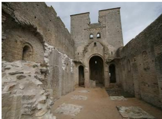
Doyenné St-Hyppolite à Bonnay (71)