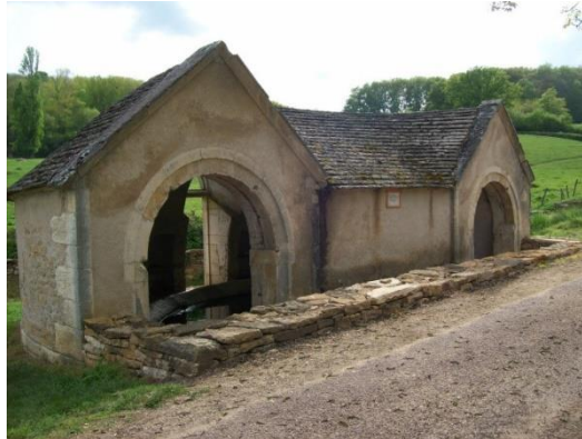
Lavoir de Rosey (71)

Aide à la mise en place du projet associatif Formation des responsables associatifs