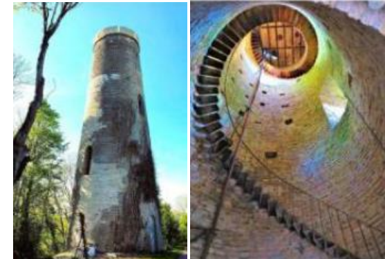
Tour de Saussy (21)