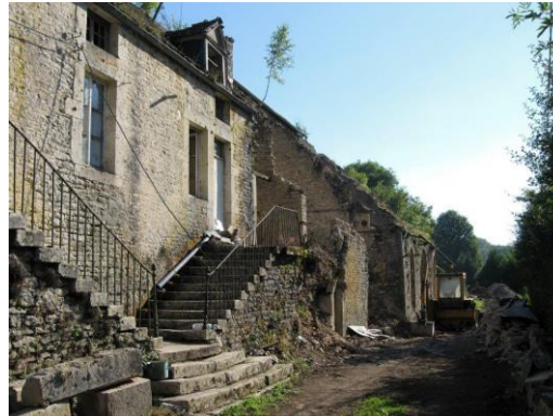
Forges de Val-Suzon (21)