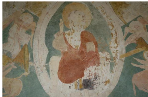
Eglise St-Denis à Buffières (71)