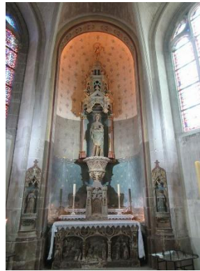
Eglise St-Jean à Joigny (89)

Aide pour la mise en place du projet de restauration Conseils pour trouver un architecte du patrimoine Suivi avec les entreprises MH Suivi avec les conservateurs-restaurateurs Suivi avec les services de la DRAC : Conservation Régionale des Monuments Historiques. Service Régional de l'Archéologie. UDAPS : Architecte des Bâtiments de France