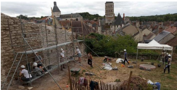
Fortifications de la Charité-sur-Loire (58)

La Fédération est facilitatrice dans les relations entre les associations et les partenaires.