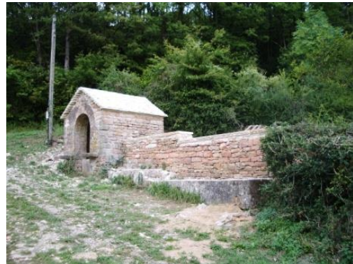
Barbettes à Martailly-les-Brancion (71)

Aide pour la mise en place du projet de restauration Conseils pour trouver un architecte du patrimoine Suivi avec les entreprises MH Suivi avec les conservateurs-restaurateurs Suivi avec les services de la DRAC : Conservation Régionale des Monuments Historiques. Service Régional de l'Archéologie. UDAPS : Architecte des Bâtiments de France