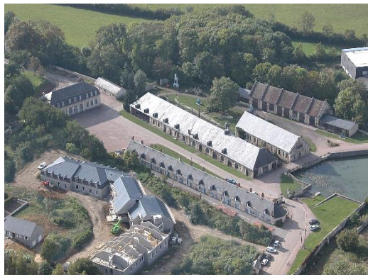
Forges de Guérigny (58)