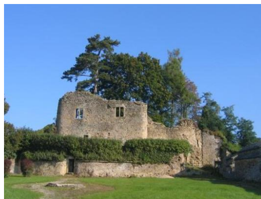
Vieux Château à Moulins-Engilbert (58)