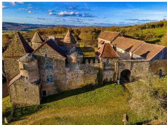
Château Pontus de Tyard à Bissy-sur-Fley (71)