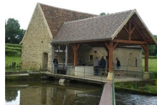
Moulin à Lugny-les-Charolles (71)