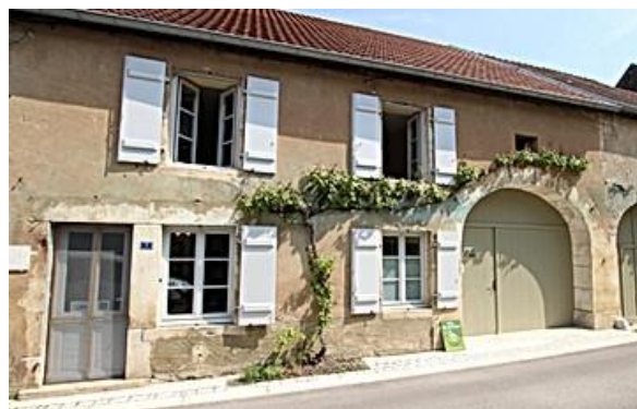
Maison Moine à Bucey-les-Gy (70)