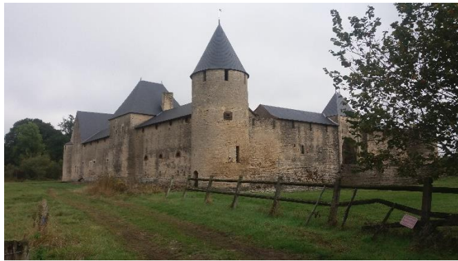
Château de Villars à St-Parize-le-Châtel (58)