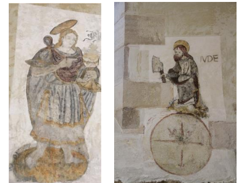
Eglise St-Martin à Savoisy (21)