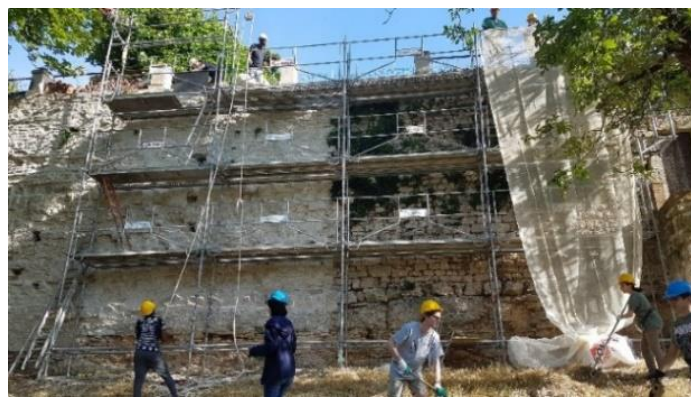
Rempart à Vézelay (89)

REMPART BFC a pour mission de coordonner des associations locales et les représenter auprès des partenaires publics : services de l'Etat, Collectivités Territoriales et Locales et des partenaires privés.