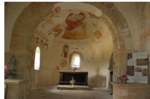
Eglise St-Martin à Semur-en-Brionnais (71)