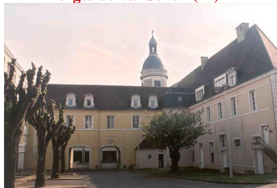
Ancien Hôpital à Chalon-sur-Saône (71)