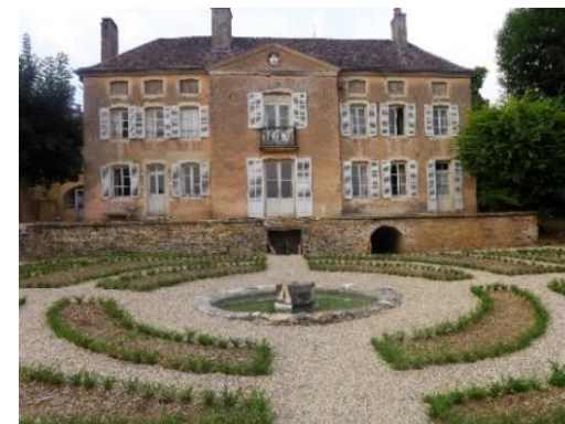
Maison Jacques Copeau à Pernand-Vergelesses (21)