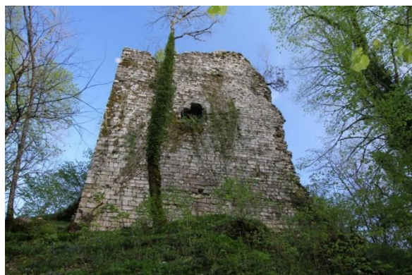
Château d'Otton à Montrond (39)