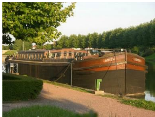
Péniche Aster à St-Jean-de-Losne (21)