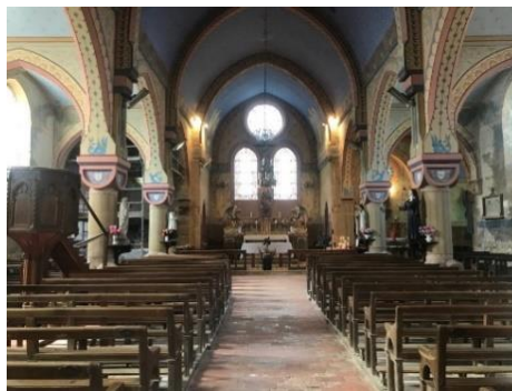
Eglise St-Pierre à Larochemillay (58)