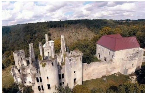
Château de Rochefort à Asnières-en-Montagne (21)