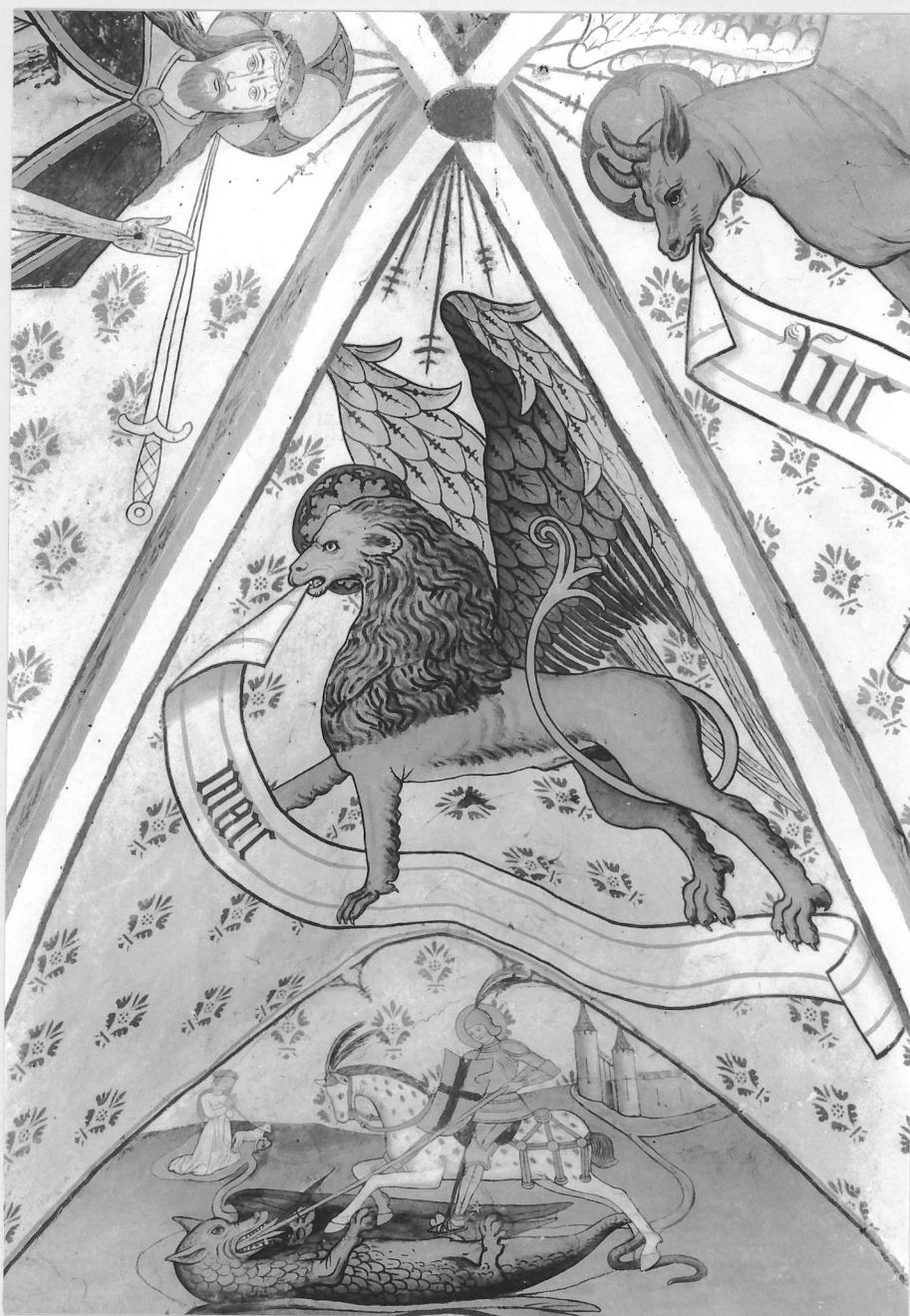
Fig. 9 Choeur, 2e travée, voûte: lion de saint Marc 86 21 1011 X 86 21 1011 ZA