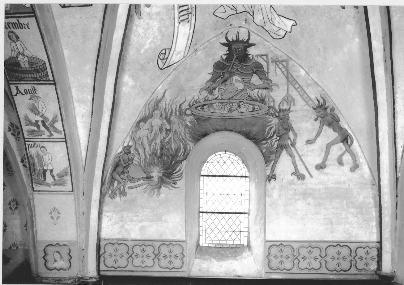
Fig.11 Choeur, lère travée, mur droit: l'Enfer 86 21 0994 V 86 21 0994 ZA