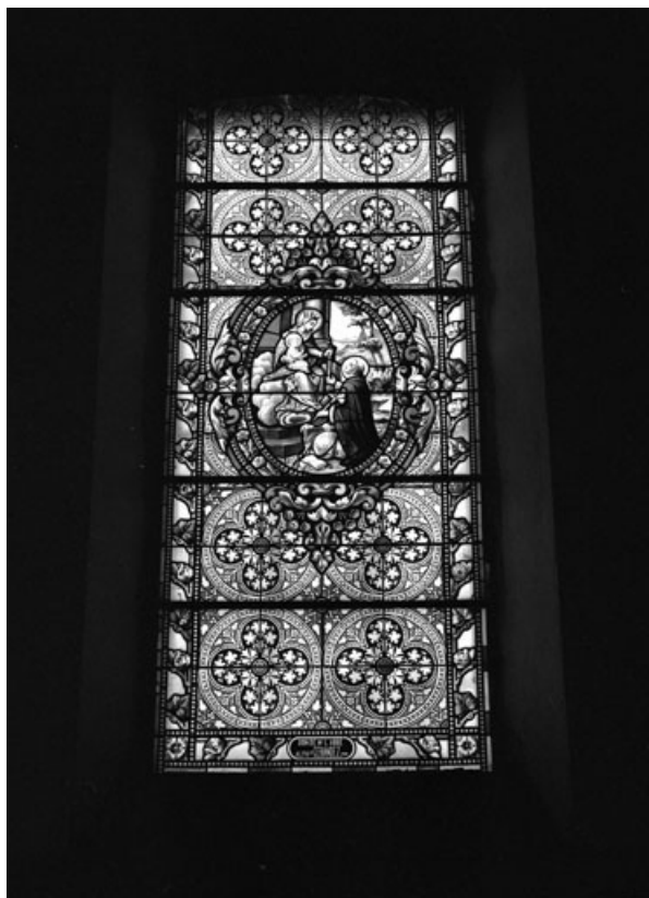
Baie 5 : vue d'ensemble.