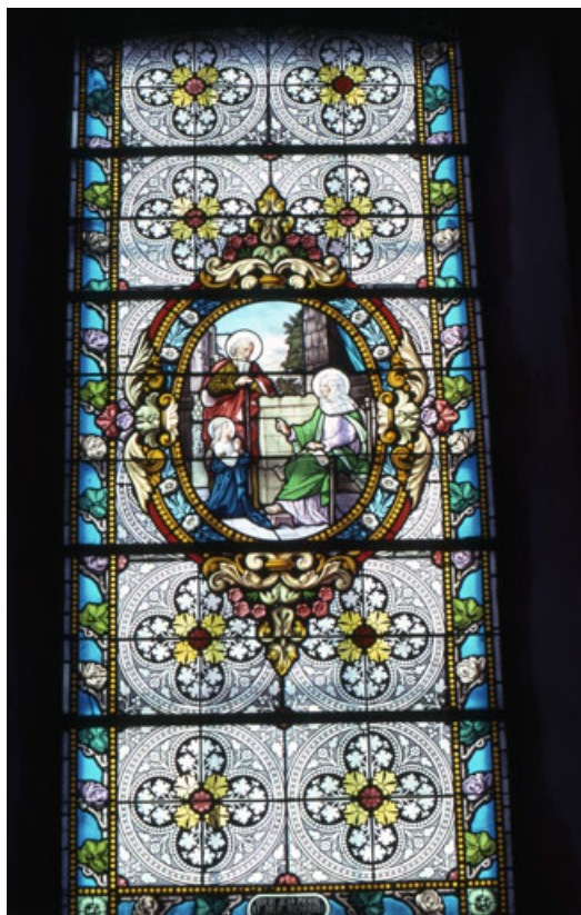
Baie 7 : vue d'ensemble.