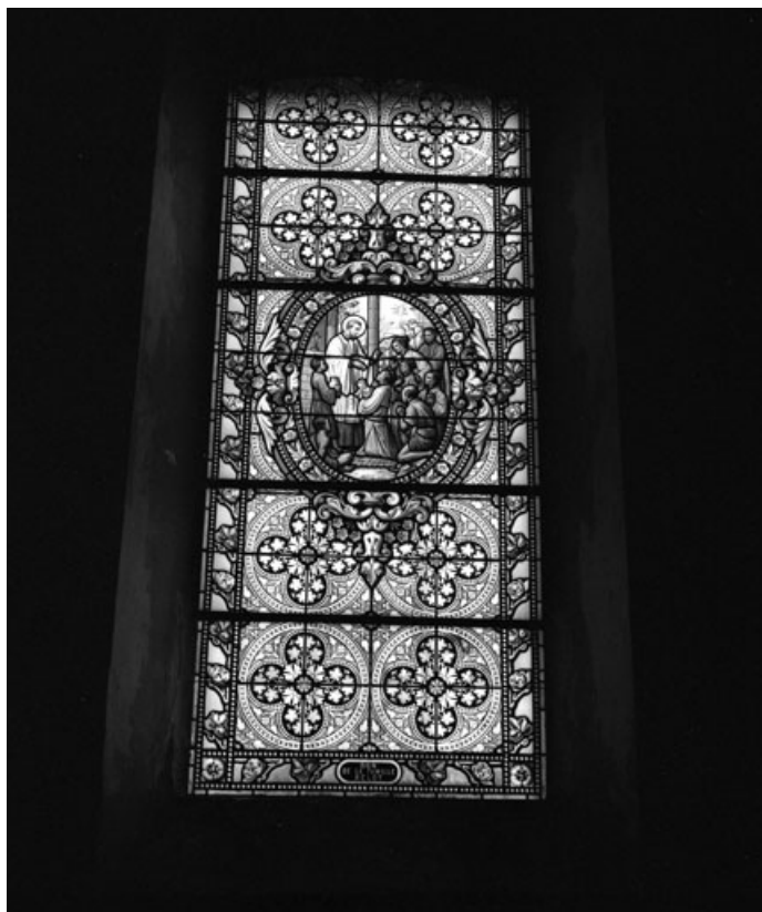
Baie 8 : vue d'ensemble; 90, Novillard