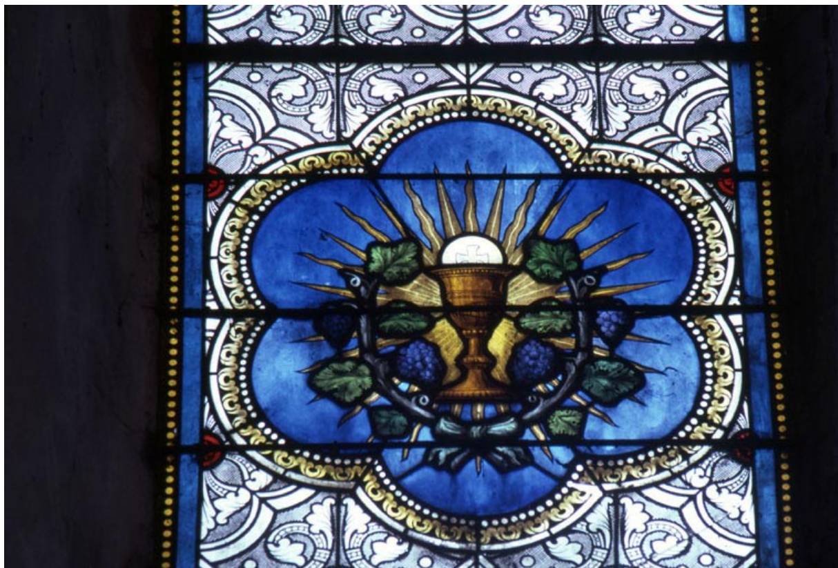
Baie 3 : médaillon central.