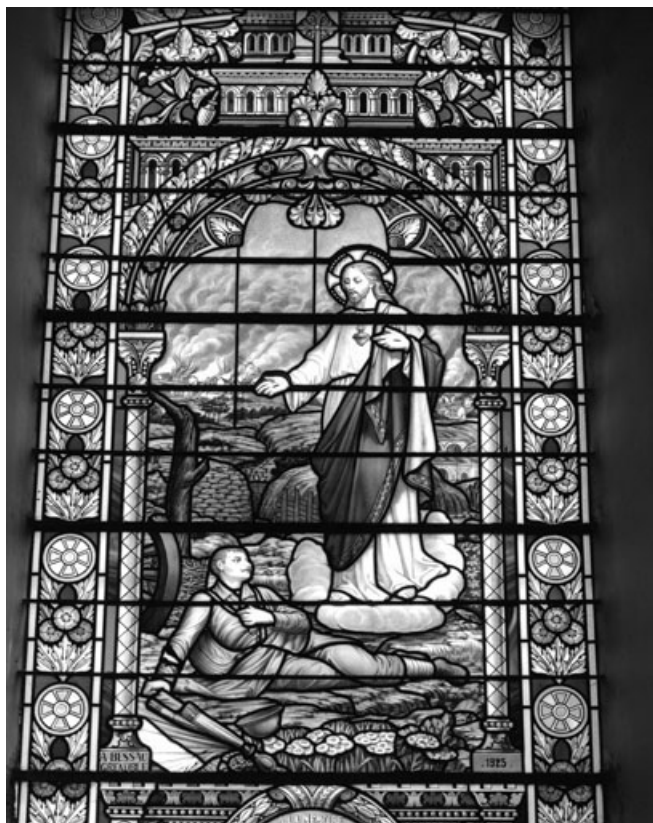
Baie 4 : vue d'ensemble.