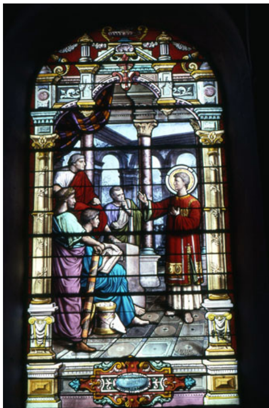
Baie 2 : vue d'ensemble.