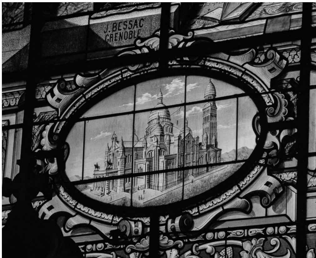
Médaille de la partie inférieure.