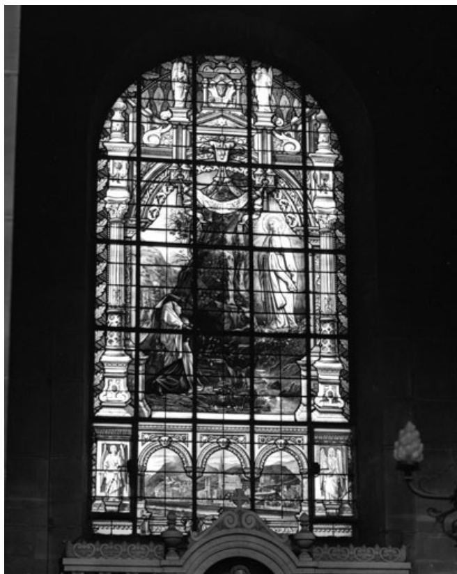
Baie 3 : vue d'ensemble.