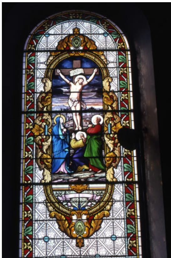
Baie 2 : vue d'ensemble.