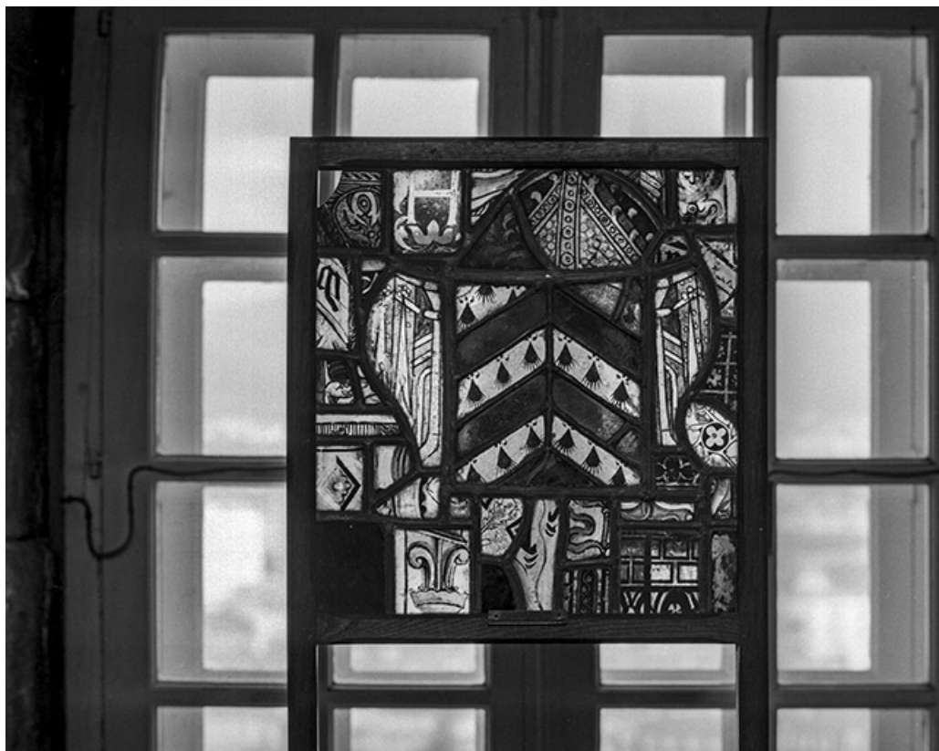
Vue d'ensemble : fragment héraldique entouré de fragments architecturaux. 90, Belfort le Château