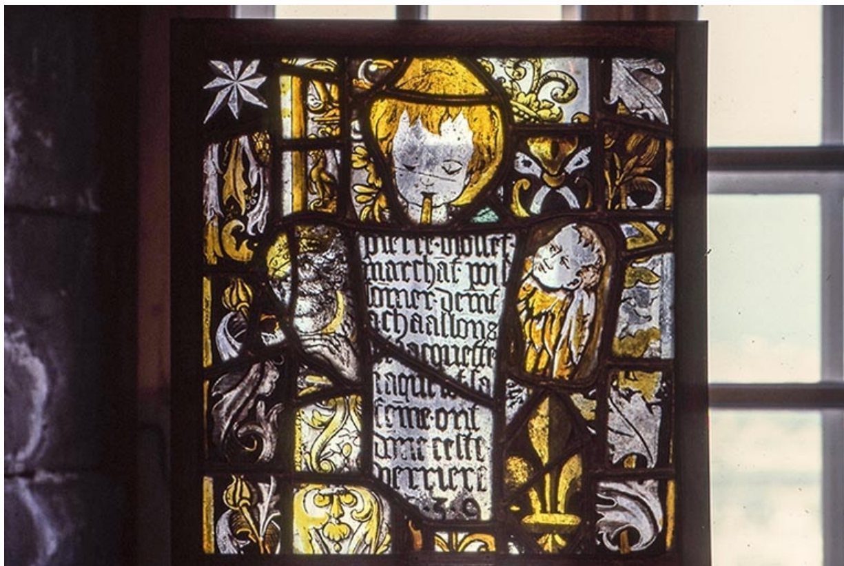
Vue d'ensemble : inscription entourée de deux têtes d'angelots, de fragments de bordures, d'une étoile, d'une tête de roi et d'une fleur de lys.