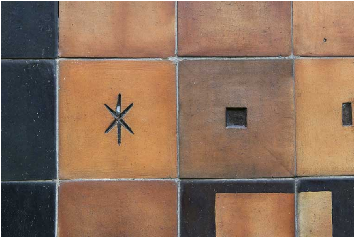
Oeuvre de Bizette. Détail de la façade sur rue.