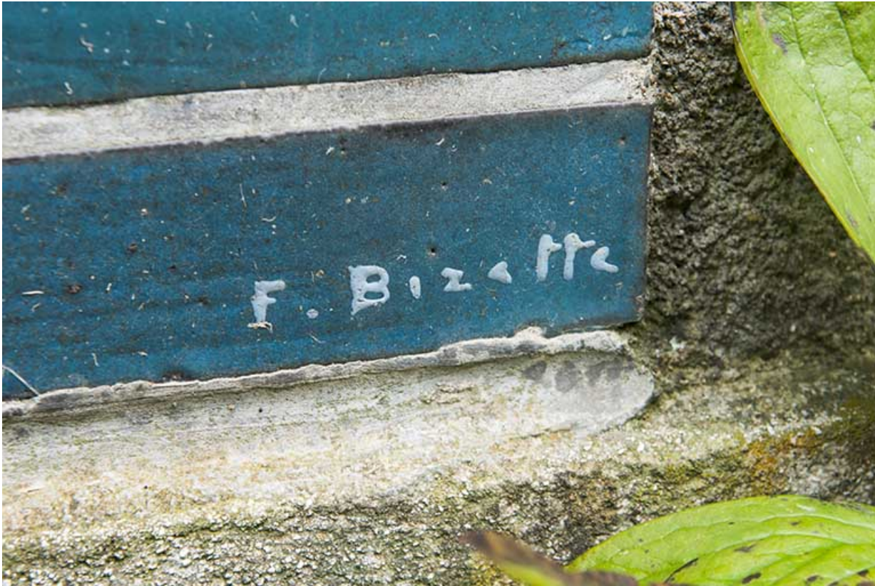
Signature de Bizette. Détail de la façade sur rue.