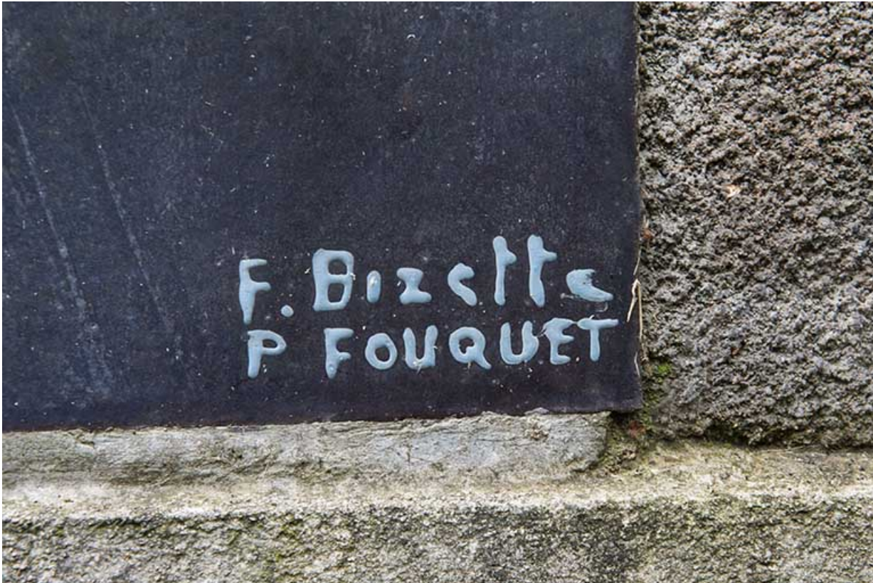
Oeuvre de Bizette sur le mur de la salle Follereau. Détail de signature.