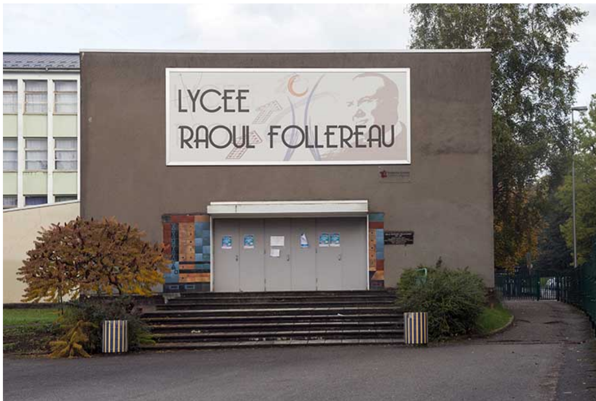
L'oeuvre autour de la porte d'entrée de la salle Follereau.