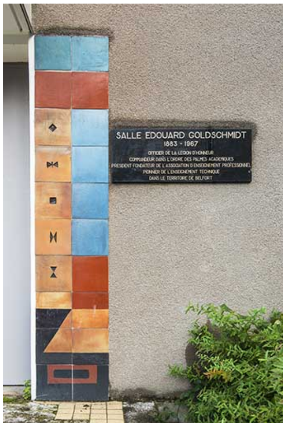
Oeuvre de Bizette. Détail du panneau droit flquant l'entrée.