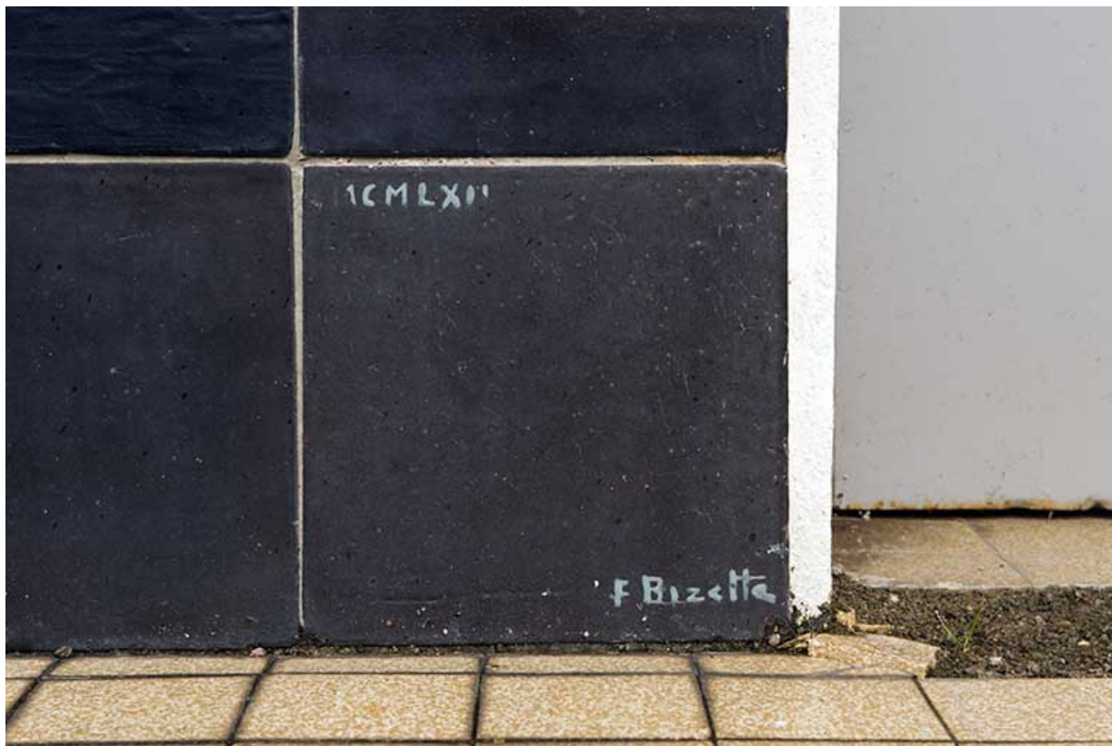
Oeuvre de Bizette. Signature et date du panneau gauche flankant l'entrée.