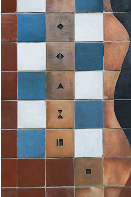
Oeuvre de Bizette. Détail de la façade sur rue.