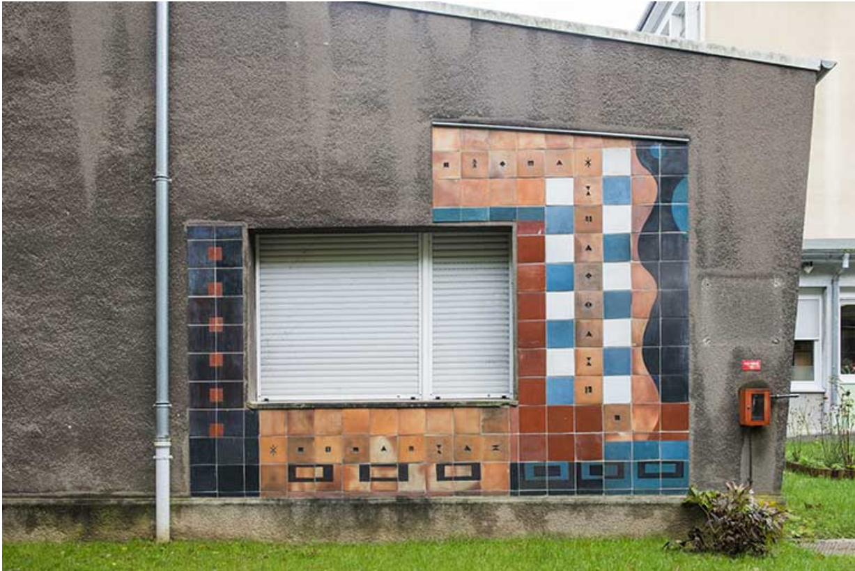
Oeuvre de Bizette. Façade sur rue.