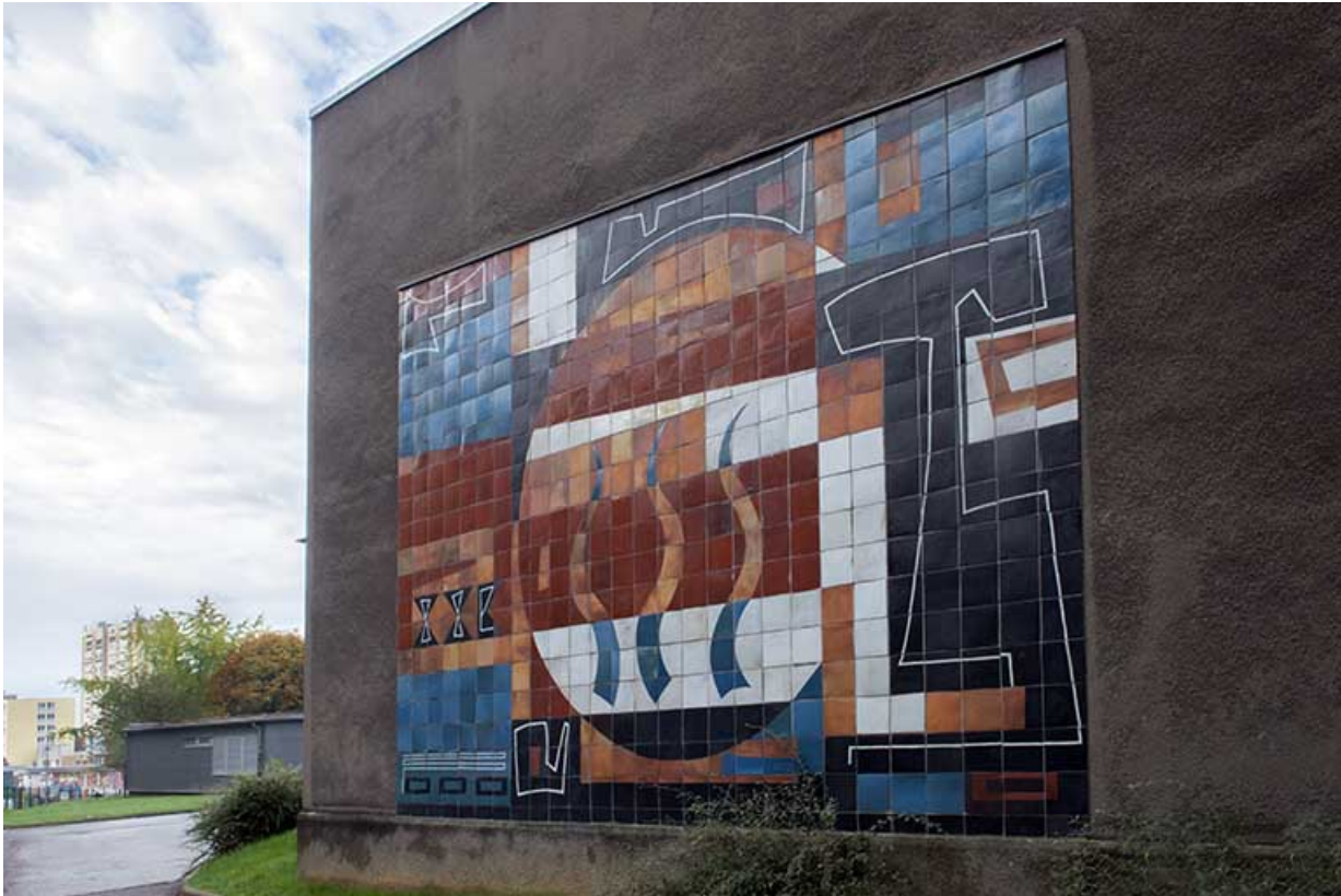
Oeuvre de Bizette sur le mur de la salle Follereau.