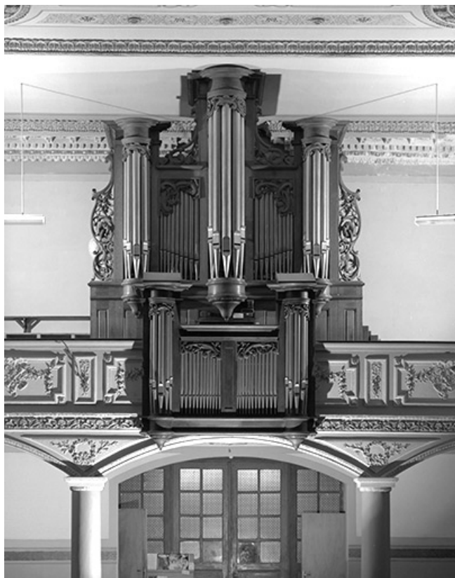
Vue générale. 90, Phaffans