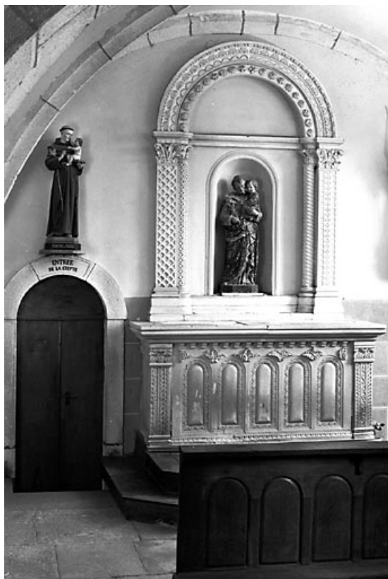
Vue d'ensemble de l'autel latéral droit.