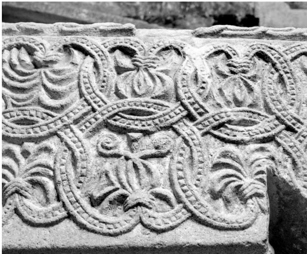
Détail du toit en bâtière. 90, Saint-Dizier-l'Évêque