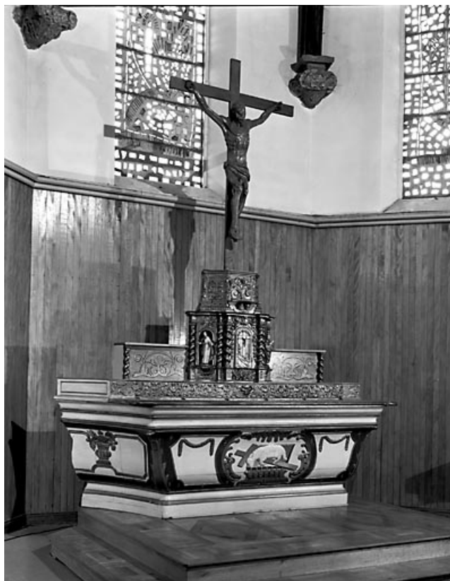
Vue d'ensemble. 90, Fêche-l'Église