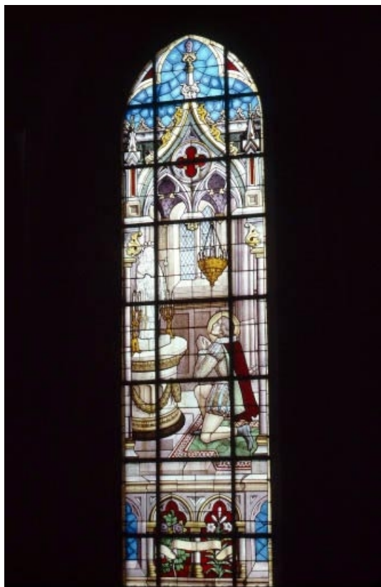
Baie 3 : vue d'ensemble.