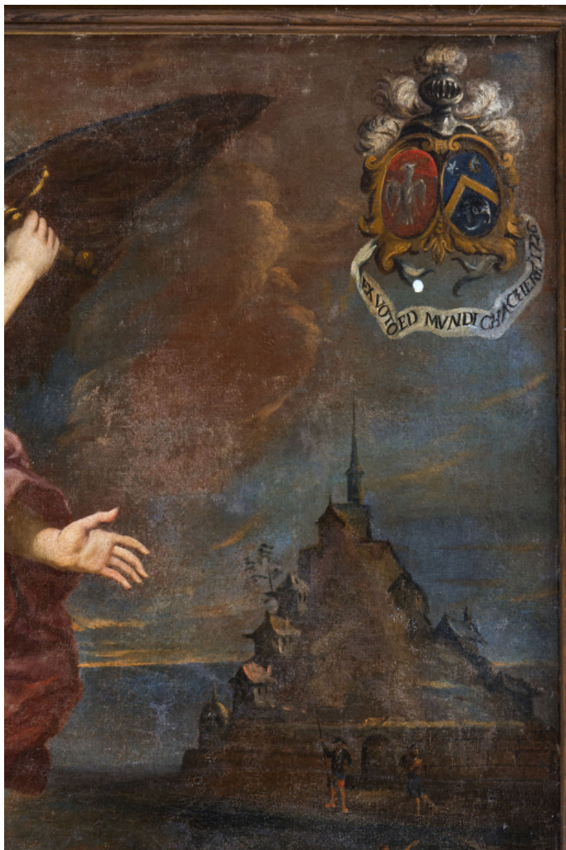
Détail : le Mont-Saint-Michel et les blasons figurant dans l'angle supérieur droit du tableau.