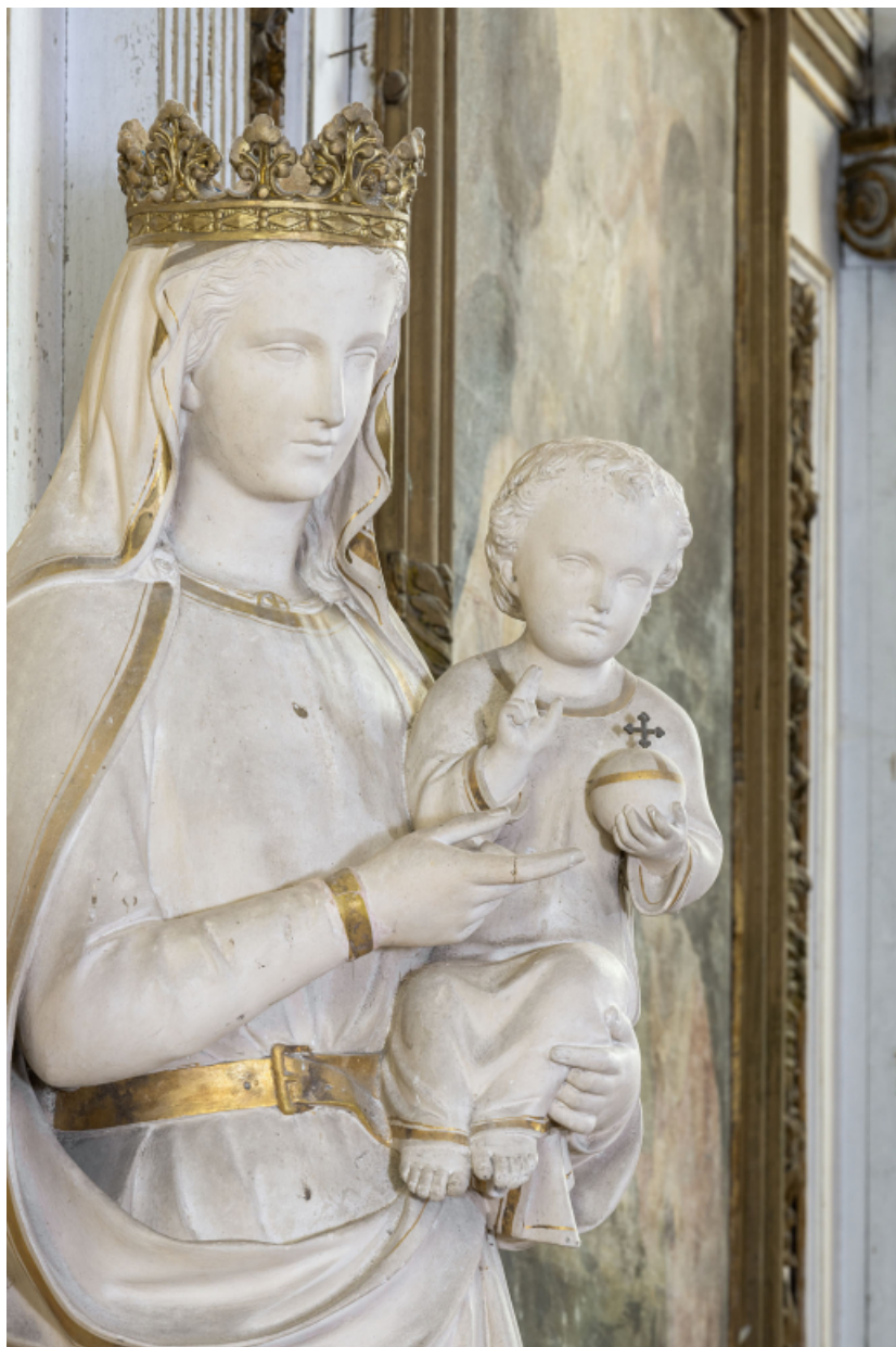
Détail de la statue de la Vierge à l'Enfant.