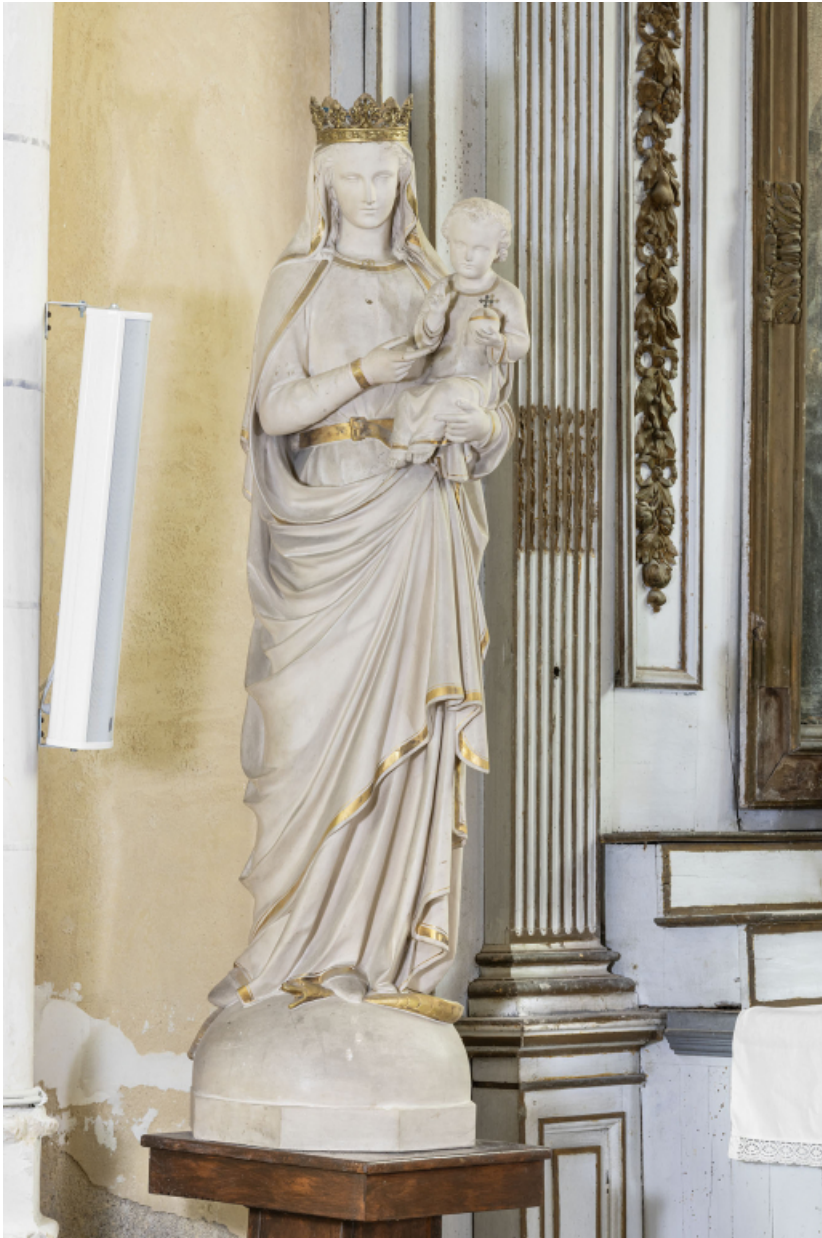
Statue représentant la Vierge à l'Enfant.