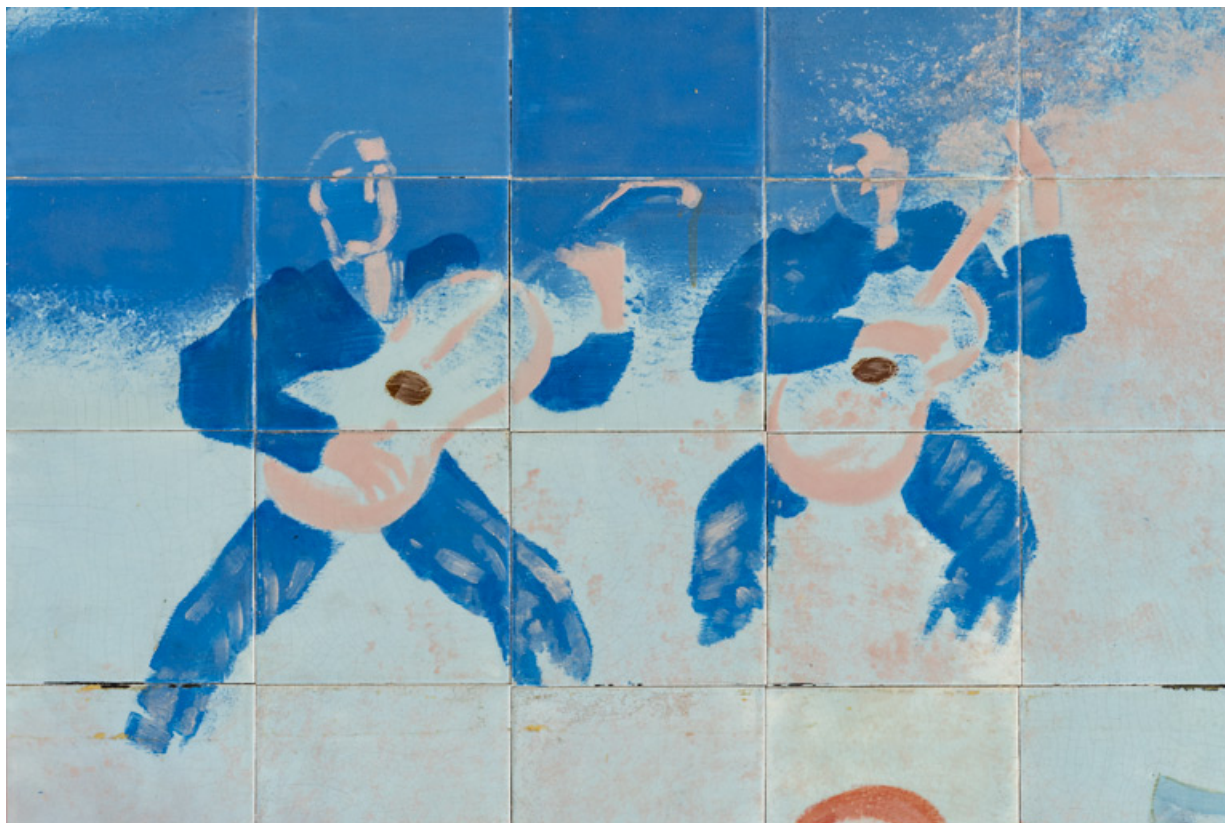
Partie centrale : détail des deux guitaristes à l'arrière-plan.