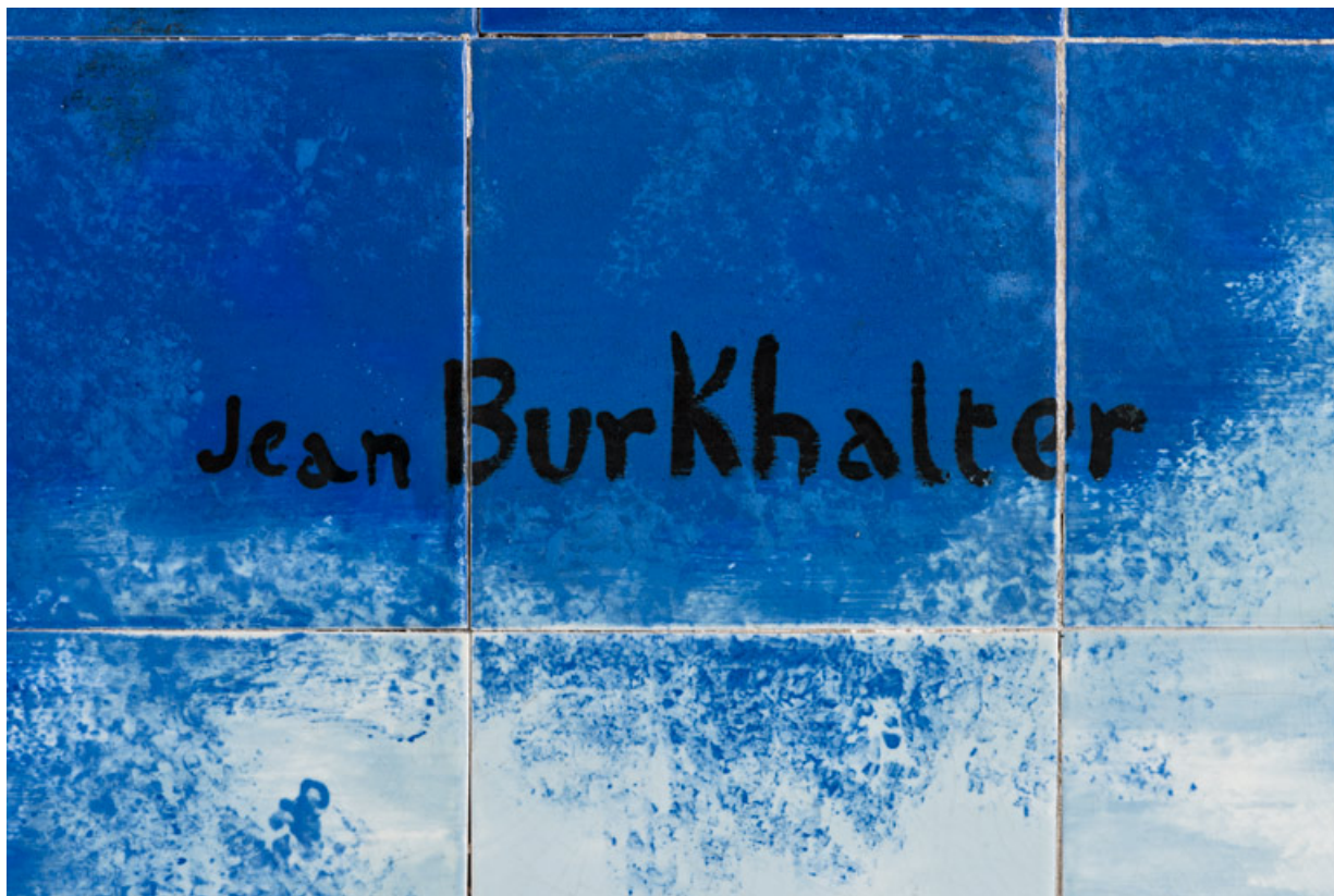
Signature de Jean Burkhalter (angle inférieur droit).