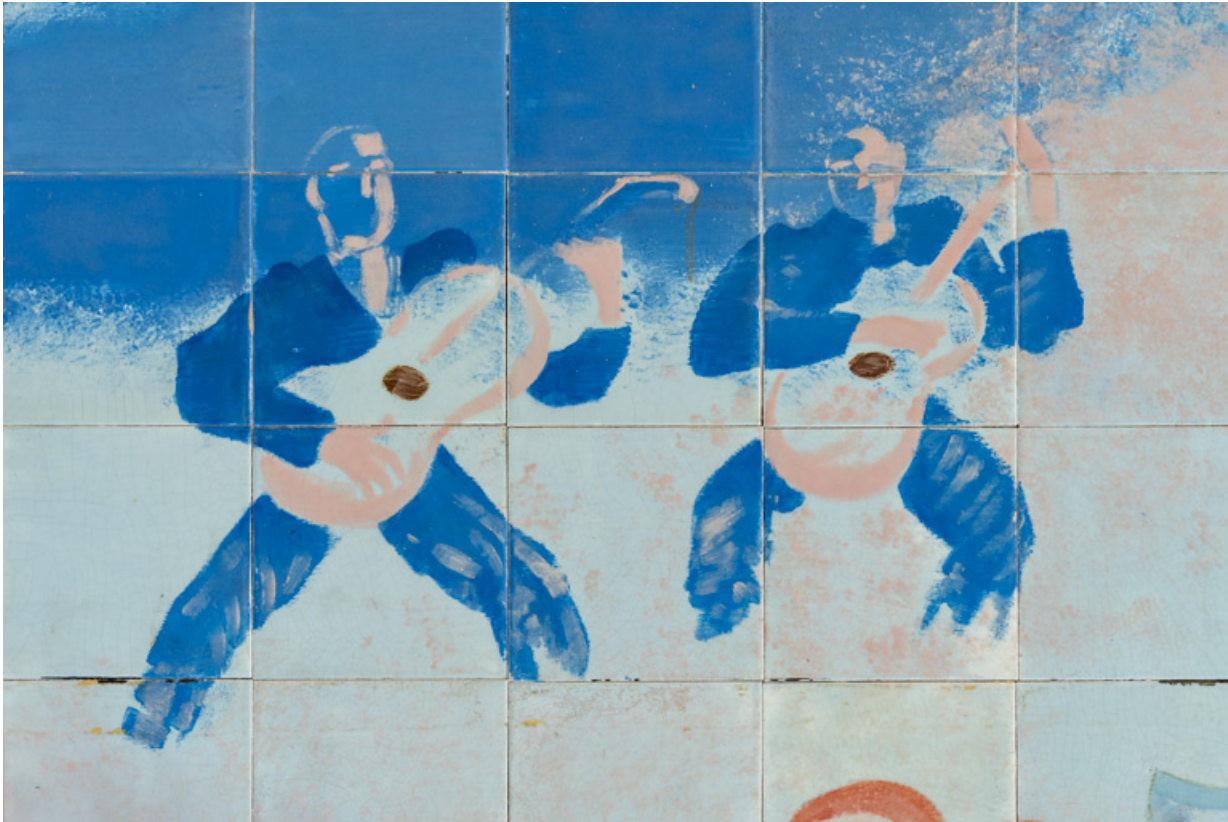
Partie centrale : détail des deux guitaristes à l'arrière-plan.