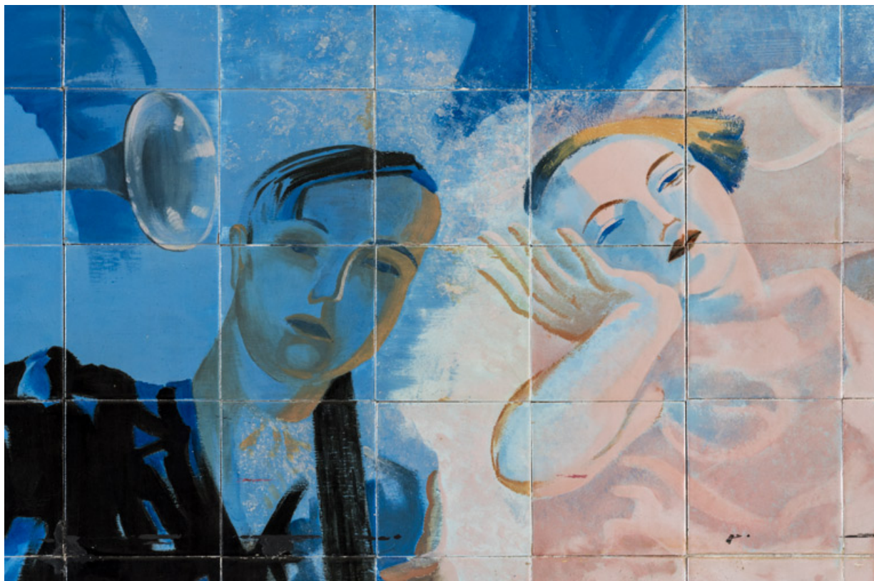
Partie centrale : musicien et danseuse (cadrage en buste).