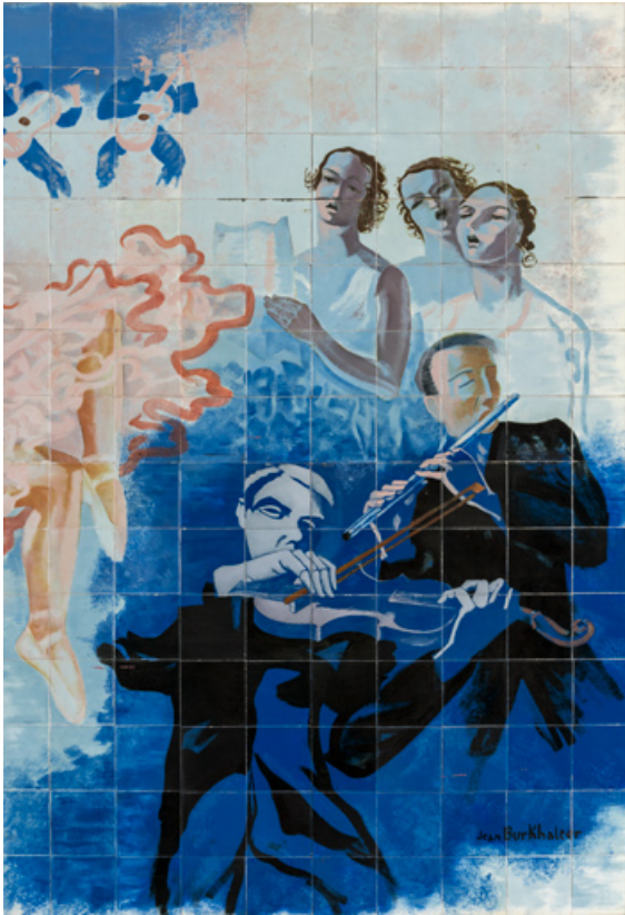
Partie droite : chanteuses et musiciens.