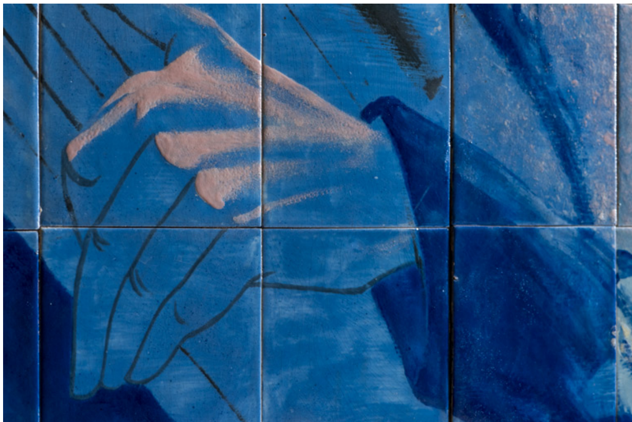
Partie gauche : main du joueur de tuba.