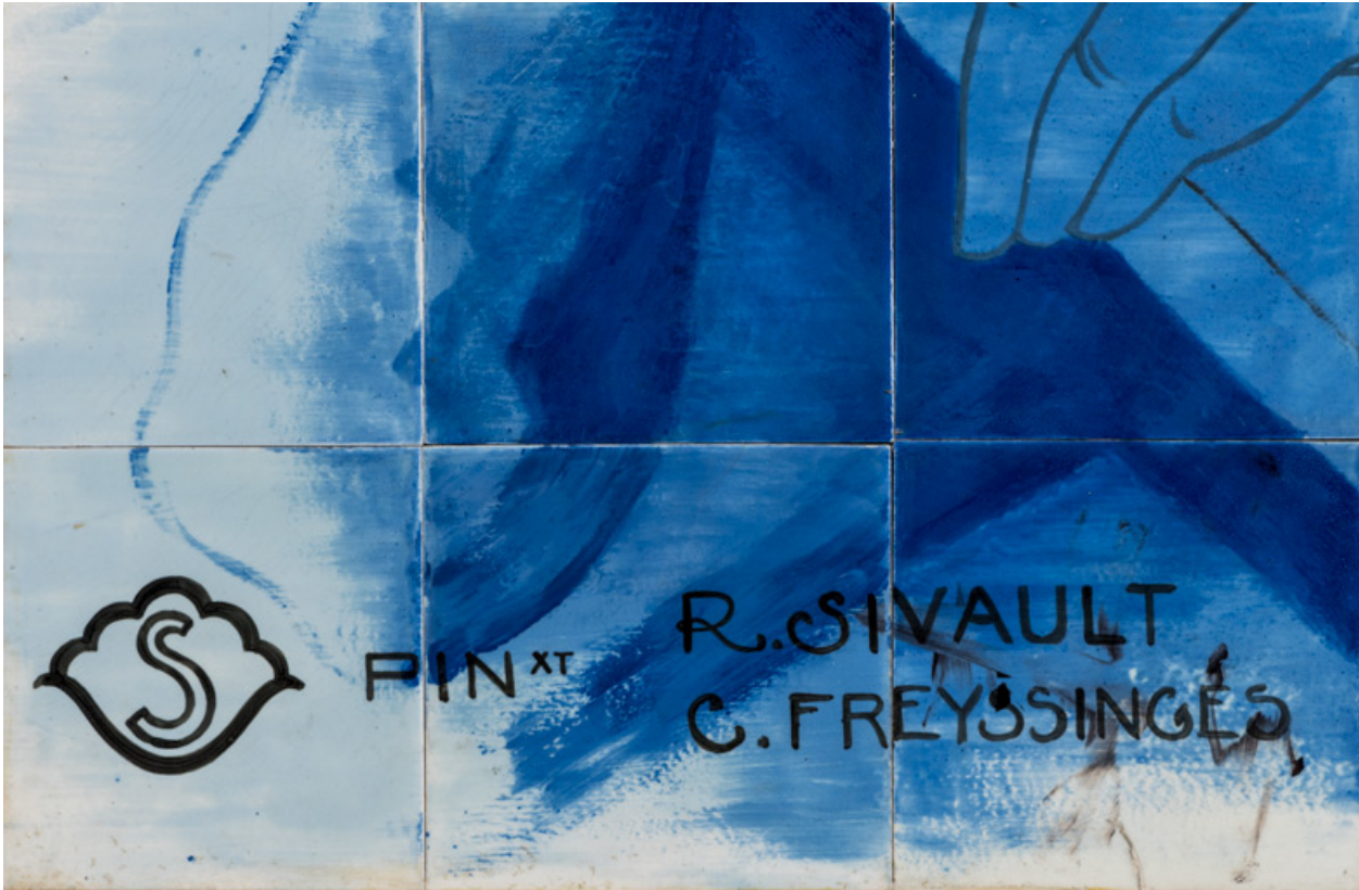
Marque de la Manufacture de Sèvres et signature des peintres R. Sivault et C. Freyssinges (angle inférieur gauche). 89, Auxerre, 56 rue Joubert