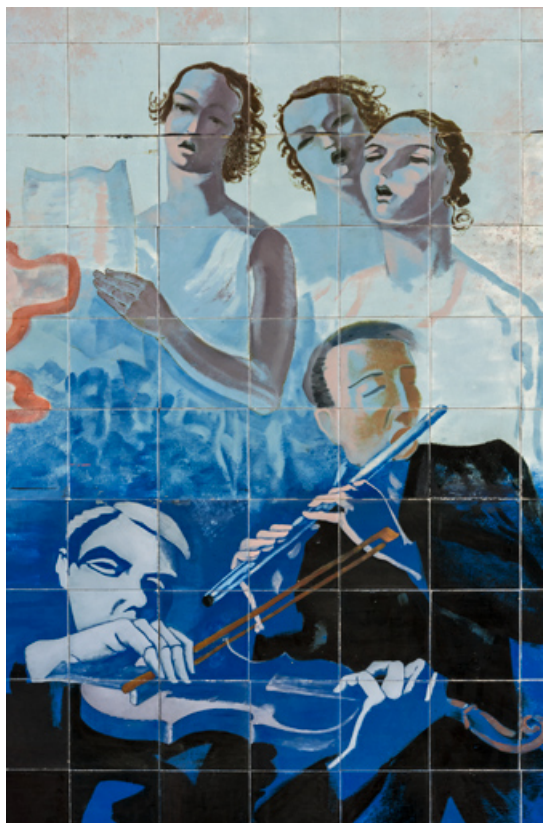
Partie droite : chanteuses et musiciens (cadrage serré). 89, Auxerre, 56 rue Joubert