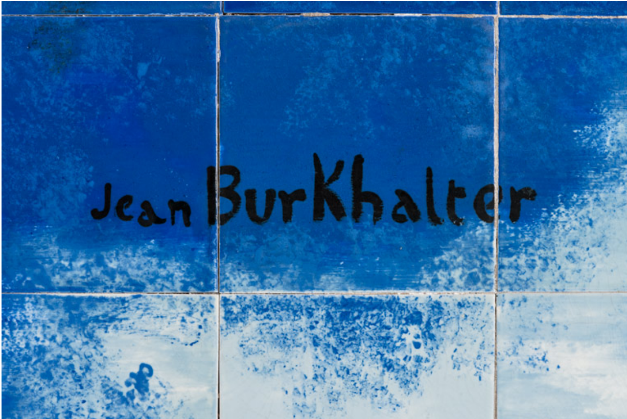
Signature de Jean Burkhalter (angle inférieur droit).