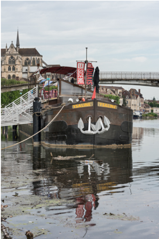
Vue d'ensemble de la proue.