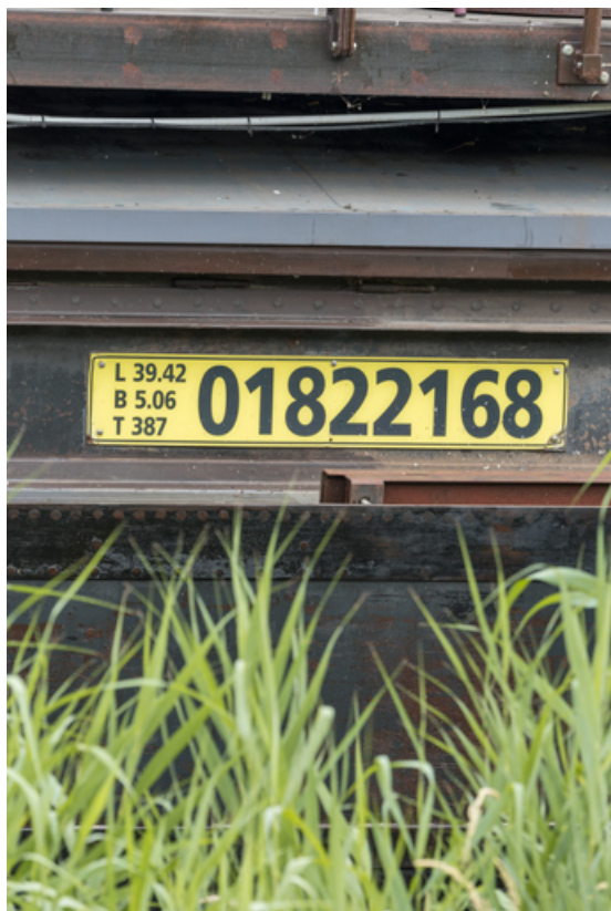
Plaque de jaugeage côté tribord. 89, Auxerre quai de la République