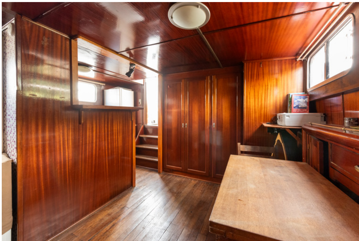
Cabine : salle de séjour, depuis la chambre. La cuisine se trouve à gauche, devant le petit escalier. 89, Auxerre quai de la République