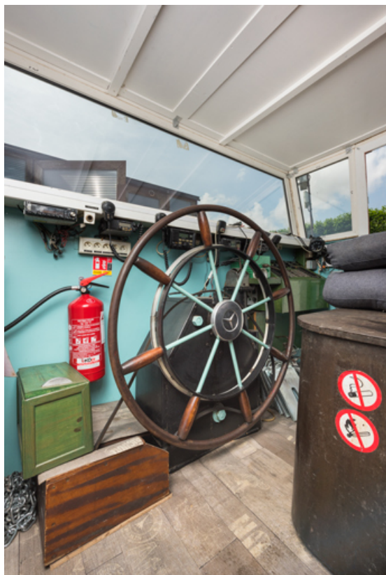
Timonerie : macaron (barre).