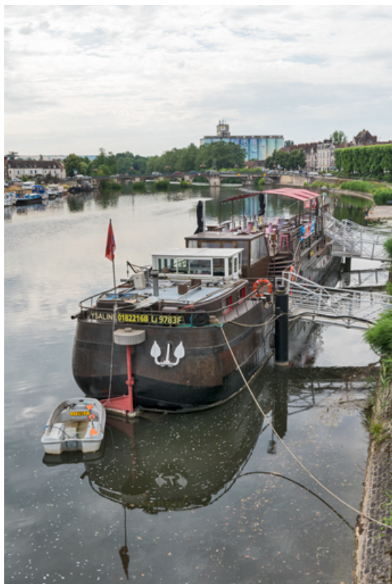
Vue d'ensemble de la poupe et du côté tribord.