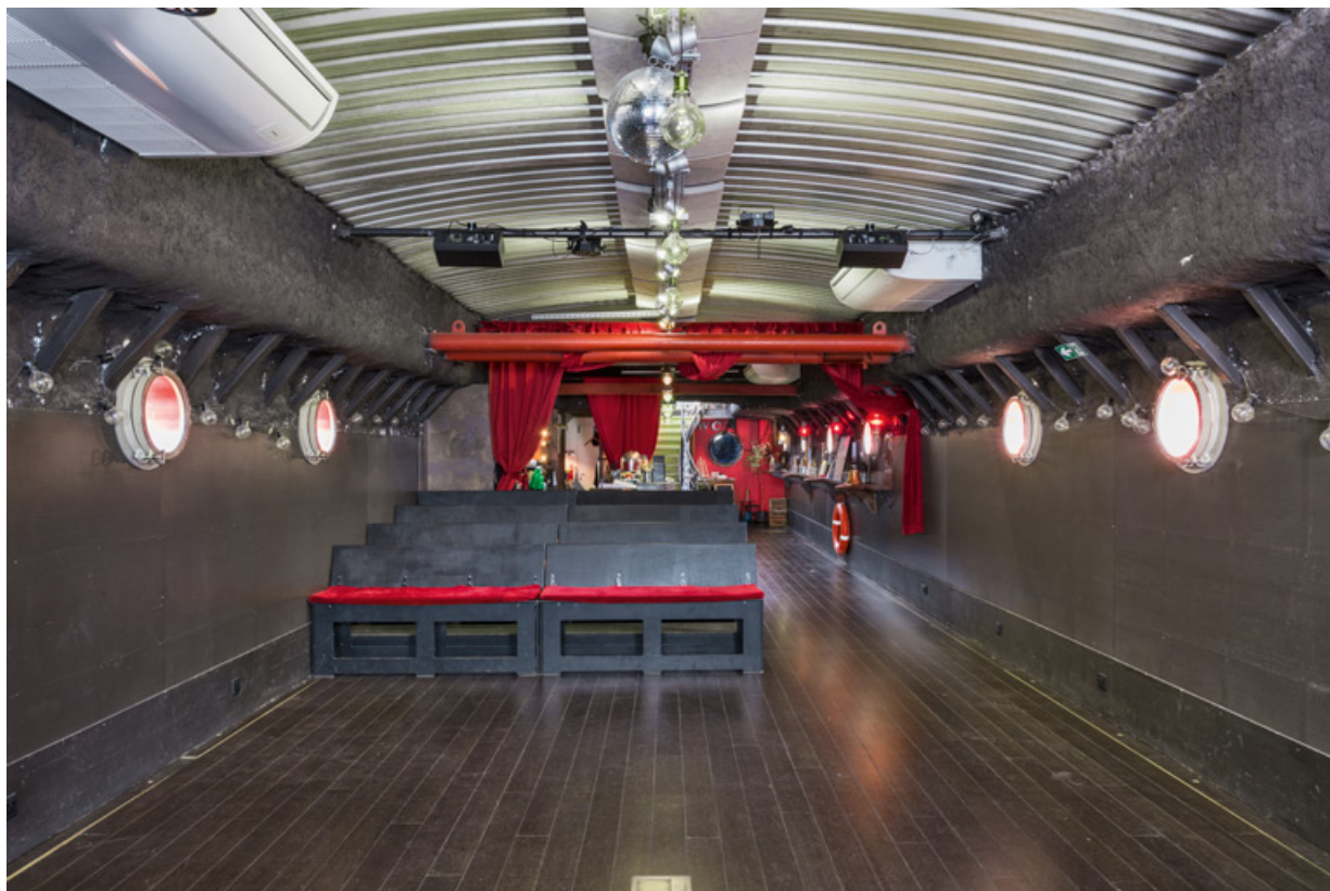
Péniche Ysaline, actuellement salle de spectacle la Scène des Quais (quai de la République) : la salle. 89, Auxerre