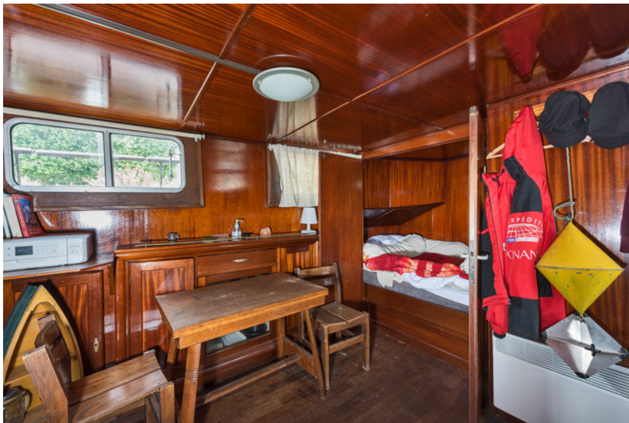
Cabine : salle de séjour et chambre (portes ouvertes).