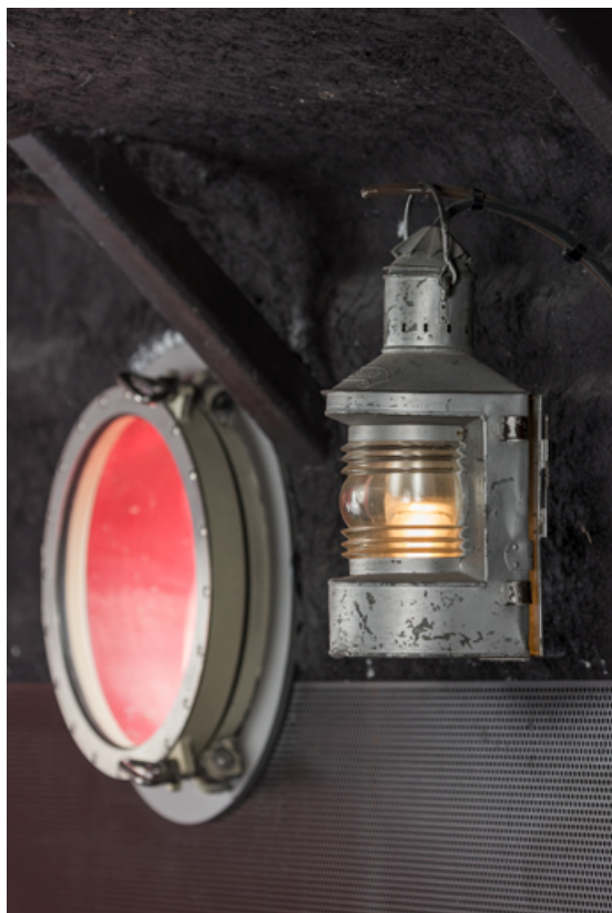
Bar : hublot et lanterne blanche.