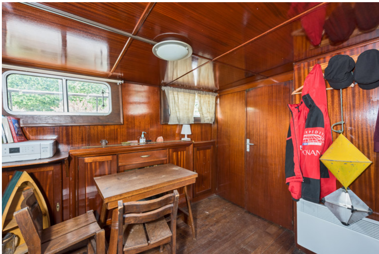
Cabine : salle de séjour et chambre (portes fermées).