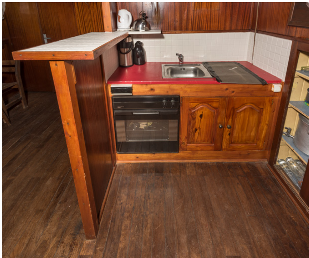
Cabine : cuisine, depuis la timonerie.