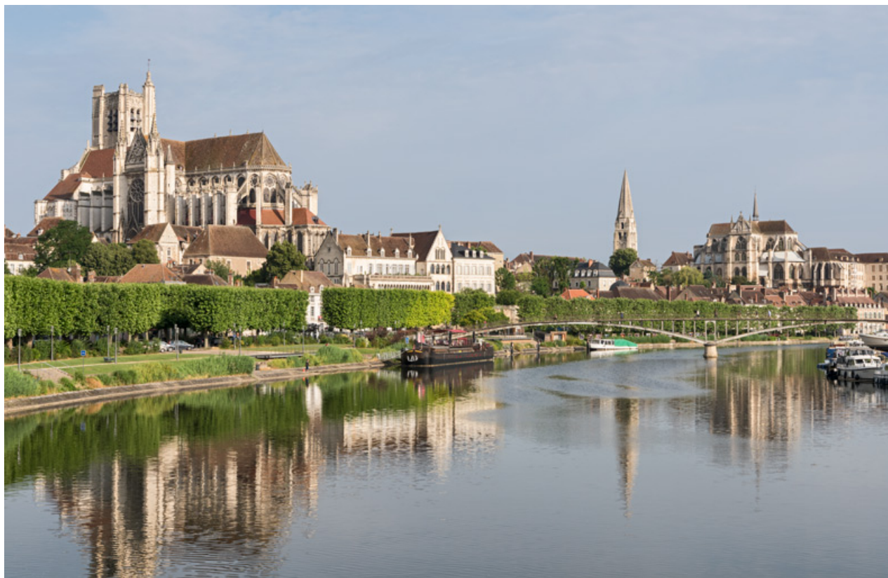
Vue d'ensemble large, avec la ville et la cathédrale en arrière-plan.