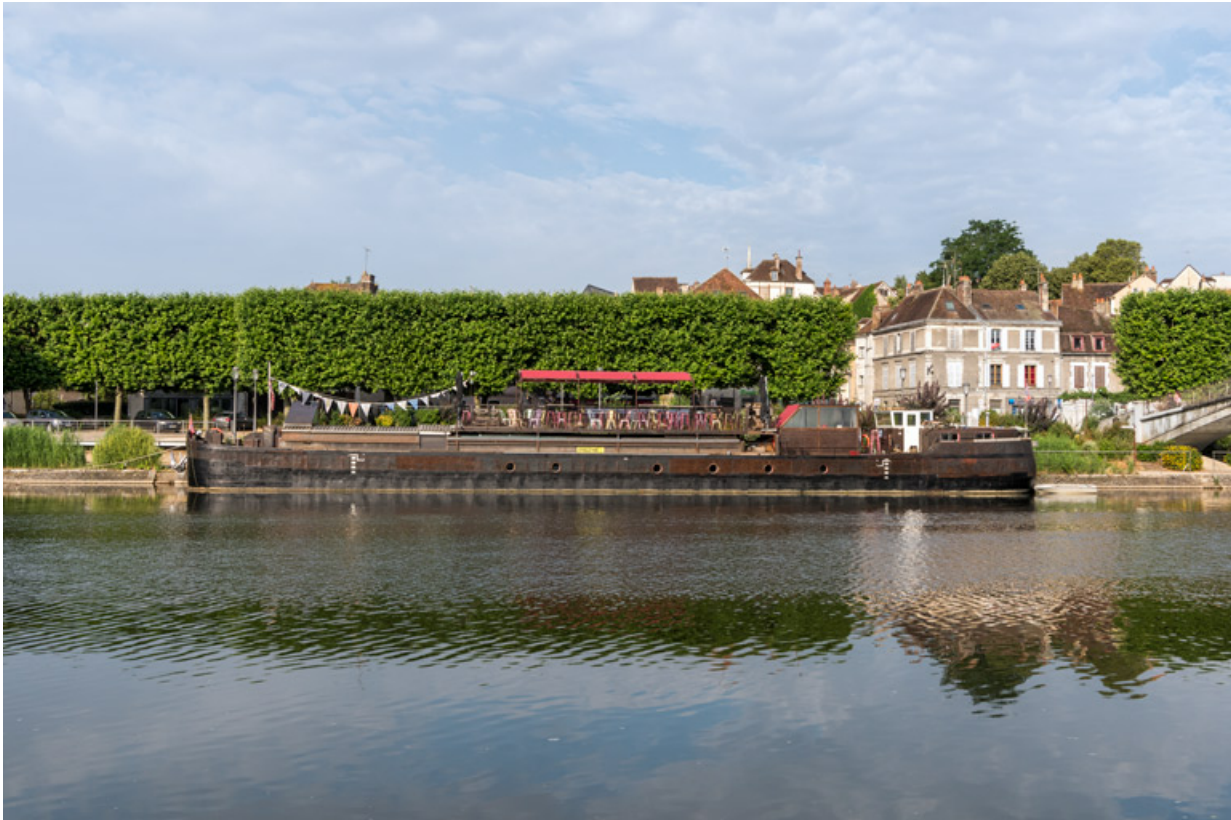
Vue d'ensemble du côté babord.