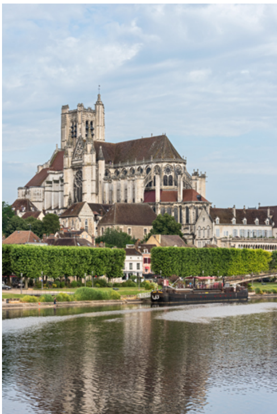
Vue d'ensemble verticale, avec la cathédrale en arrière-plan.