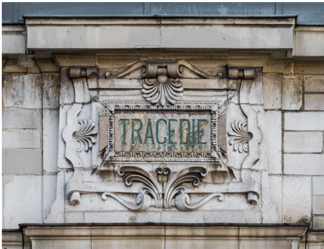
Façade latérale gauche, attique : inscription Tragédie.