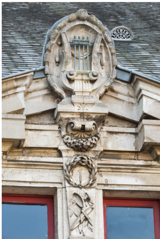
Façade latérale gauche, attique : amortissement de la travée centrale. 89, Sens, 1-2 boulevard des Garibaldi