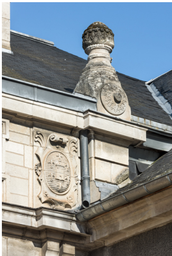
Façade latérale droite, attique : armoiries de la ville et amortissement sur l'angle droit. 89, Sens, 1-2 boulevard des Garibaldi