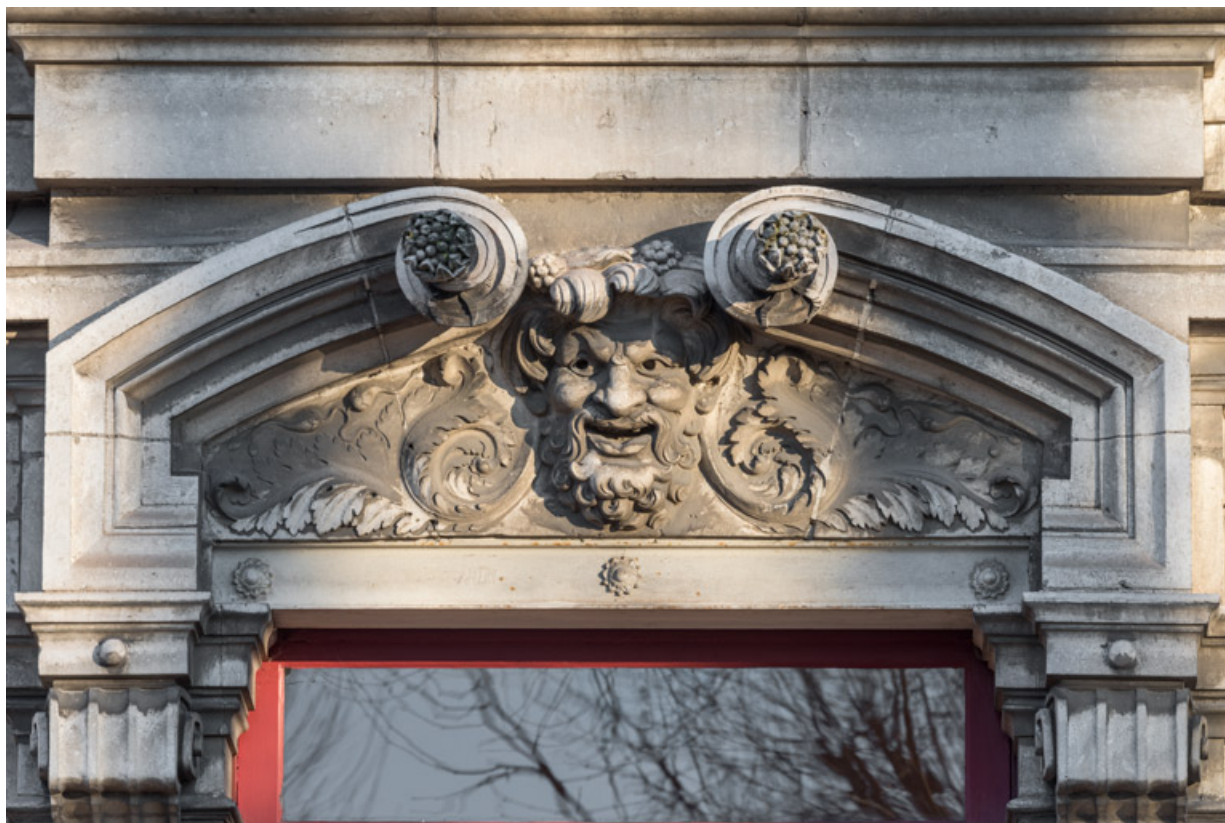
Façade latérale droite, étage carré : linteau avec le masque de la Comédie. 89, Sens, 1-2 boulevard des Garibaldi