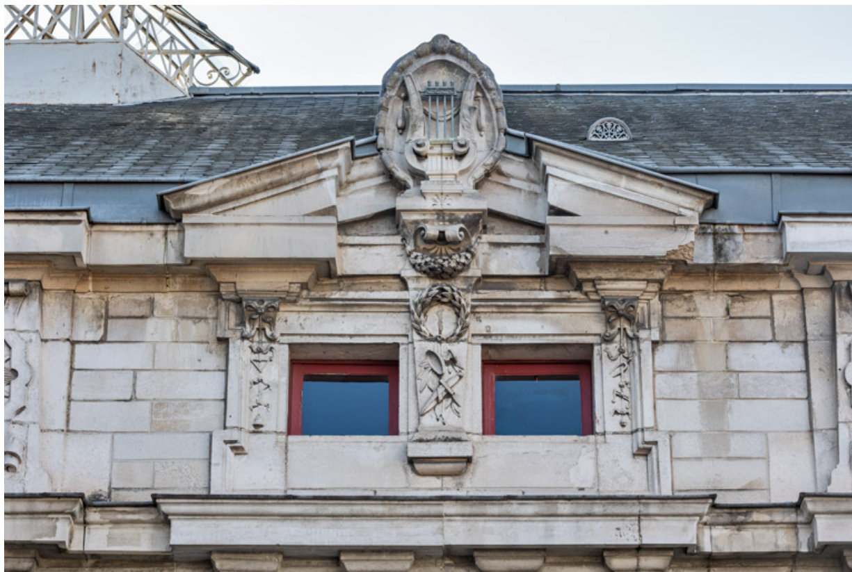
Façade latérale gauche, attique : baies et fronton formant l'amortissement de la travée centrale. 89, Sens, 1-2 boulevard des Garibaldi