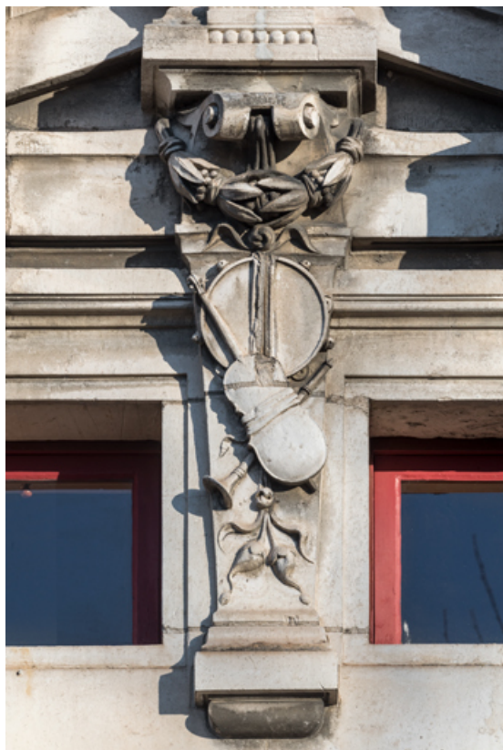
Façade latérale droite, attique : trophée de musique sous le fronton formant l'amortissement de la travée centrale. 89, Sens, 1-2 boulevard des Garibaldi