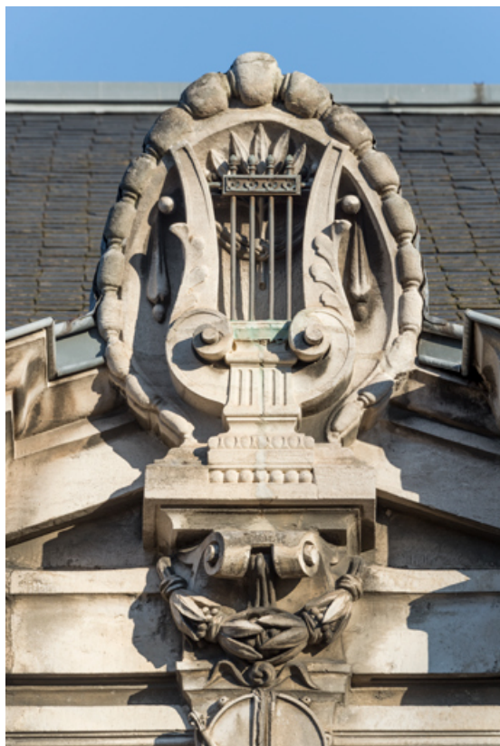
Façade latérale droite, attique : amortissement de la travée centrale. 89, Sens, 1-2 boulevard des Garibaldi