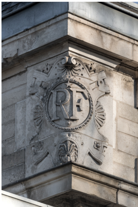
Façade latérale droite, attique : inscription RF sur l'angle gauche.