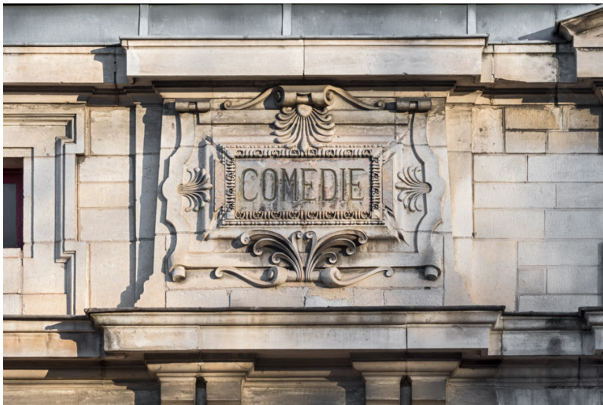
Façade latérale droite, attique : inscription Comédie.