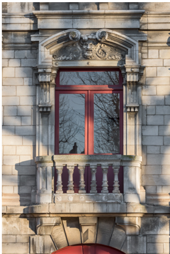
Façade latérale droite, étage carré : baie centrale.