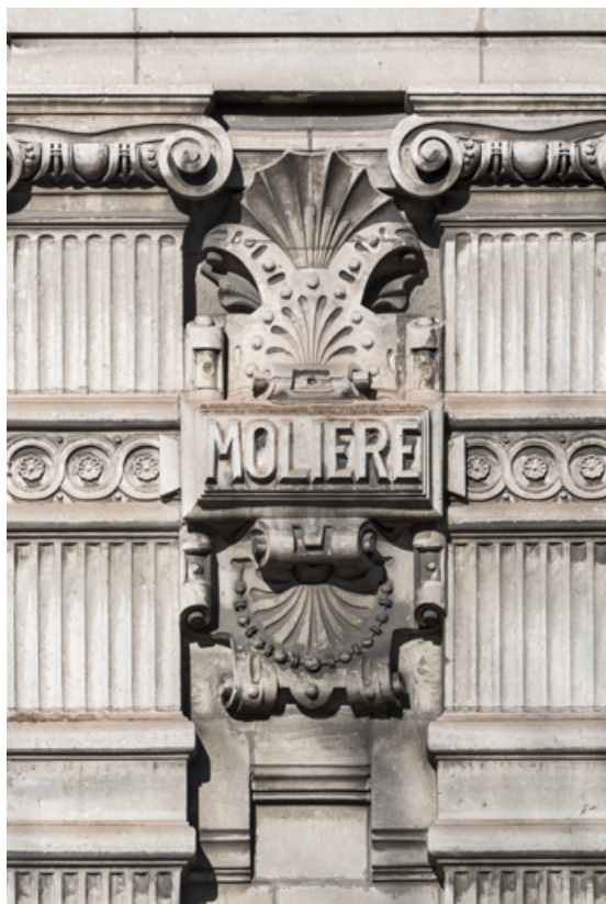
Façade latérale droite, étage carré : inscription Molière. 89, Sens, 1-2 boulevard des Garibaldi