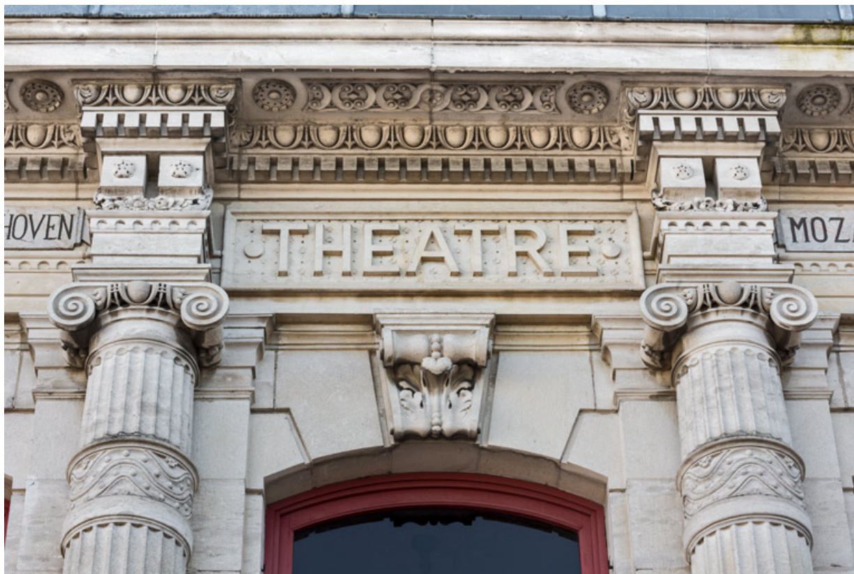
Façade antérieure : inscription Théâtre sur la travée centrale.