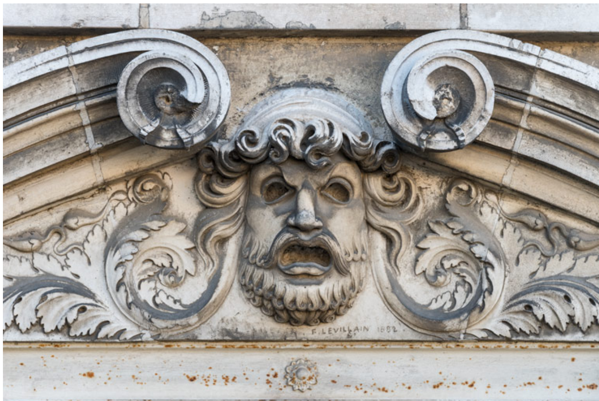
Façade latérale gauche, étage carré : masque de la Tragédie, signature F. Levillain et date 1882. 89, Sens, 1-2 boulevard des Garibaldi