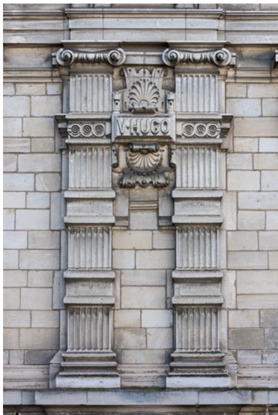
Façade latérale gauche, étage carré : pilastres et inscription V. Hugo. 89, Sens, 1-2 boulevard des Garibaldi