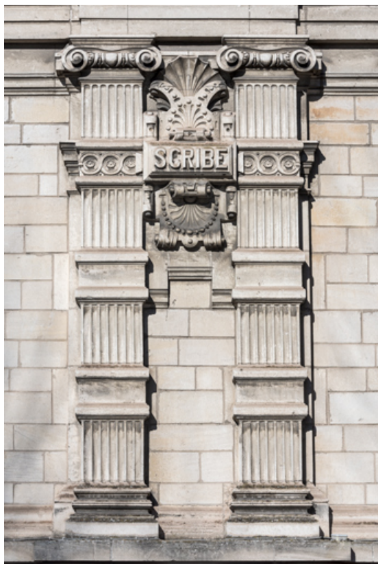
Façade latérale droite, étage carré : pilastres et inscription Scribe. 89, Sens, 1-2 boulevard des Garibaldi