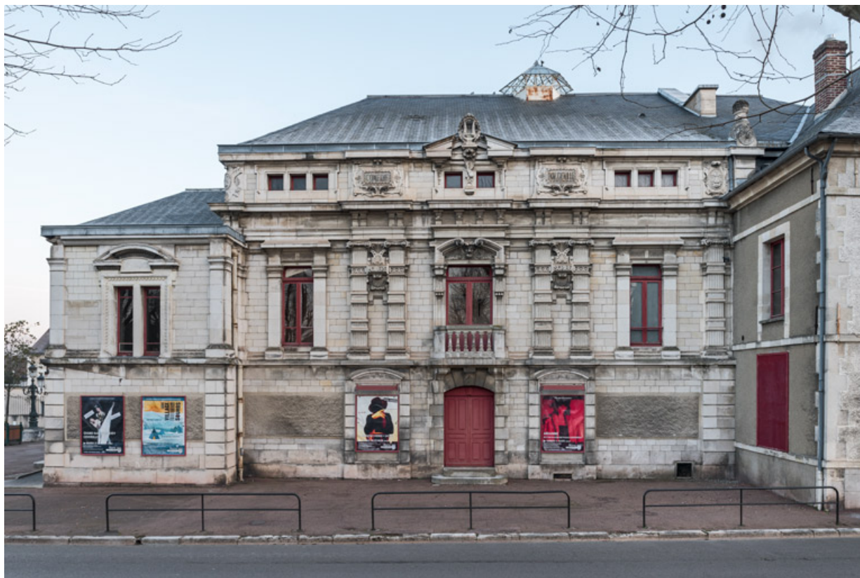
Façade latérale droite (côté cour).