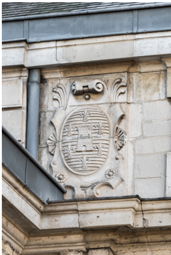
Façade latérale gauche, attique : armoiries de la ville. 89, Sens, 1-2 boulevard des Garibaldi