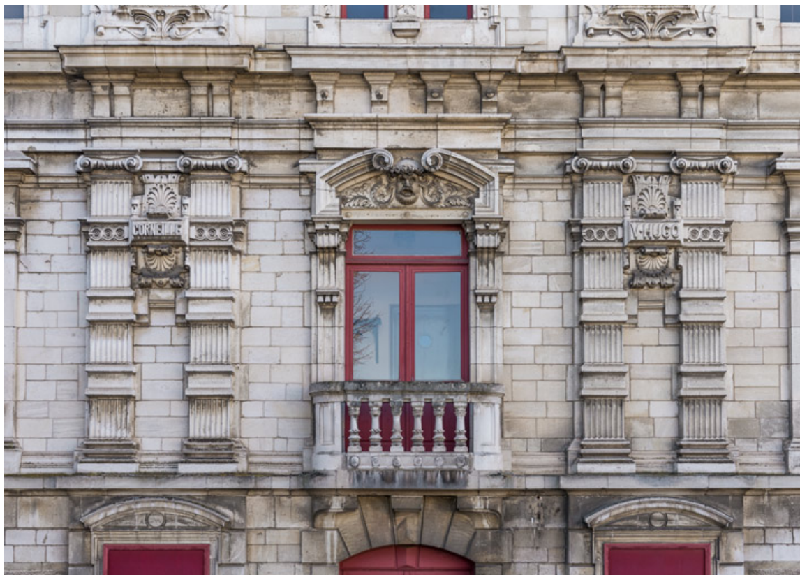
Façade latérale gauche : étage carré. 89, Sens, 1-2 boulevard des Garibaldi