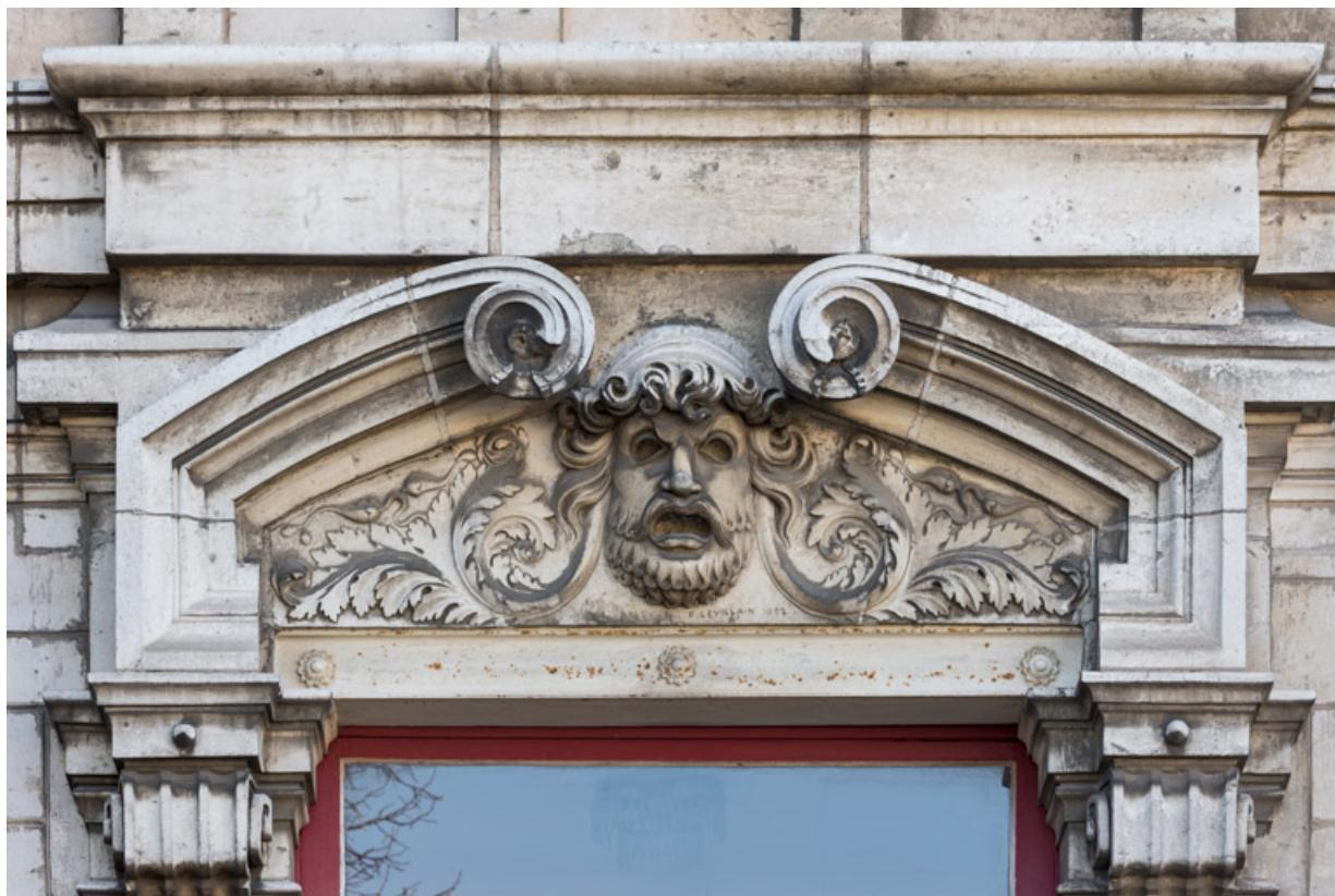
Façade latérale gauche, étage carré : linteau avec le masque de la Tragédie. 89, Sens, 1-2 boulevard des Garibaldi