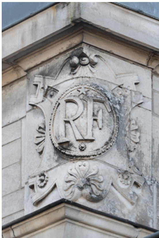
Façade latérale gauche, attique : inscription RF sur l'angle droit. 89, Sens, 1-2 boulevard des Garibaldi