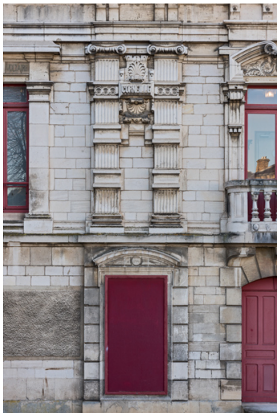
Façade latérale gauche : travée à gauche de l'entrée. 89, Sens, 1-2 boulevard des Garibaldi