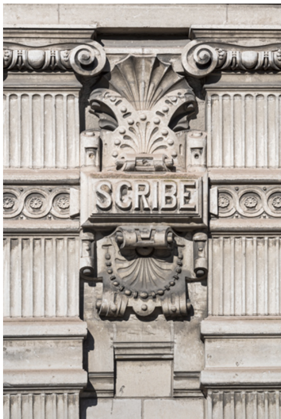
Façade latérale droite, étage carré : inscription Scribe. 89, Sens, 1-2 boulevard des Garibaldi