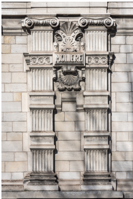
Façade latérale droite, étage carré : pilastres et inscription Molière. 89, Sens, 1-2 boulevard des Garibaldi