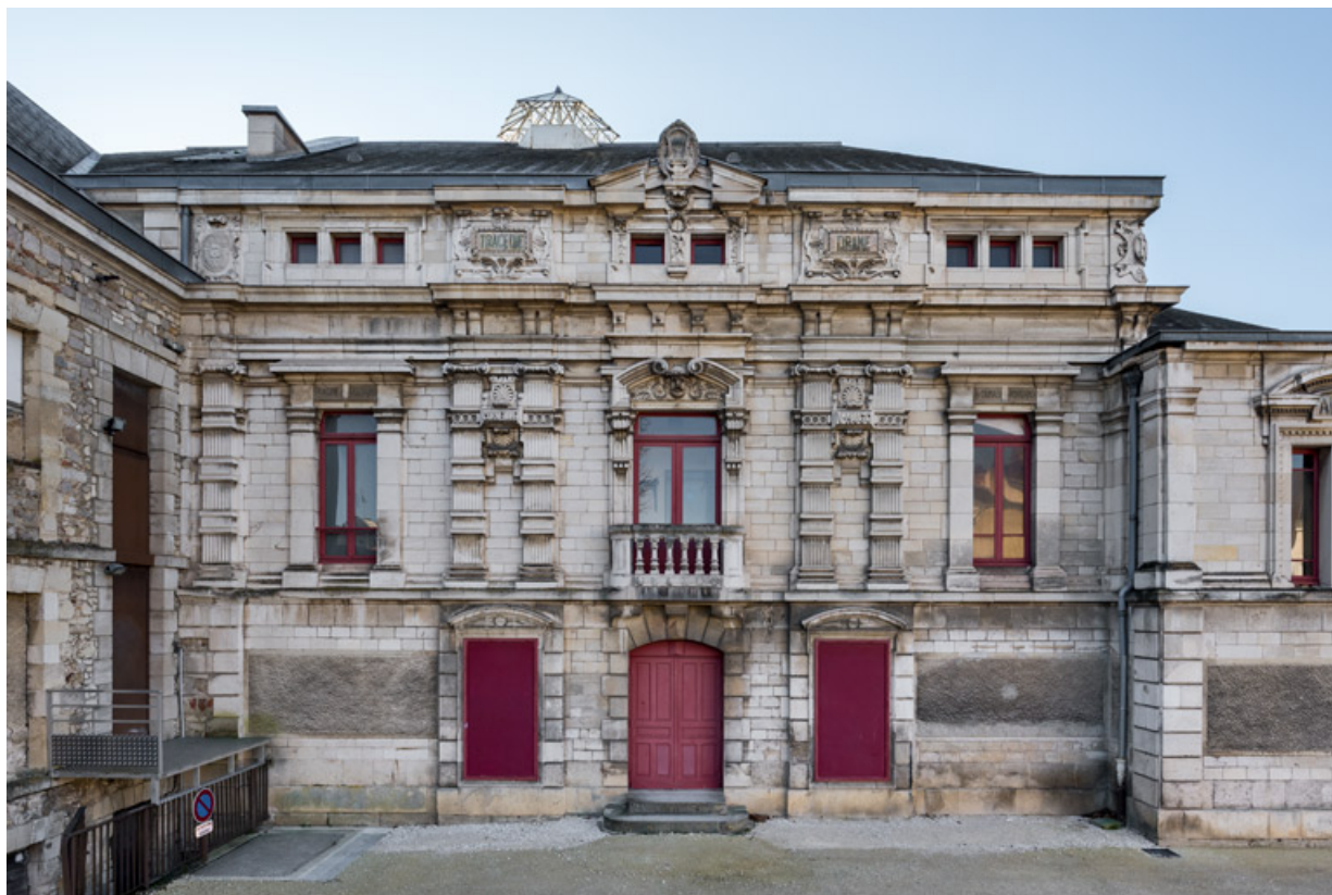
Façade latérale gauche (côté jardin).