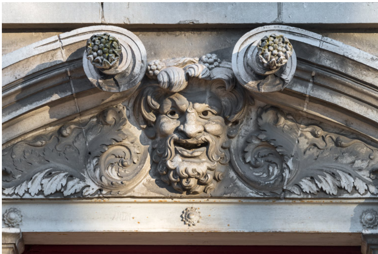
Façade latérale droite, étage carré : masque de la Comédie.