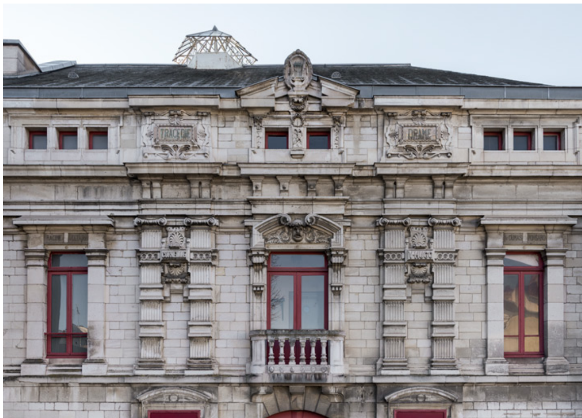
Façade latérale gauche : étage carré et attique.