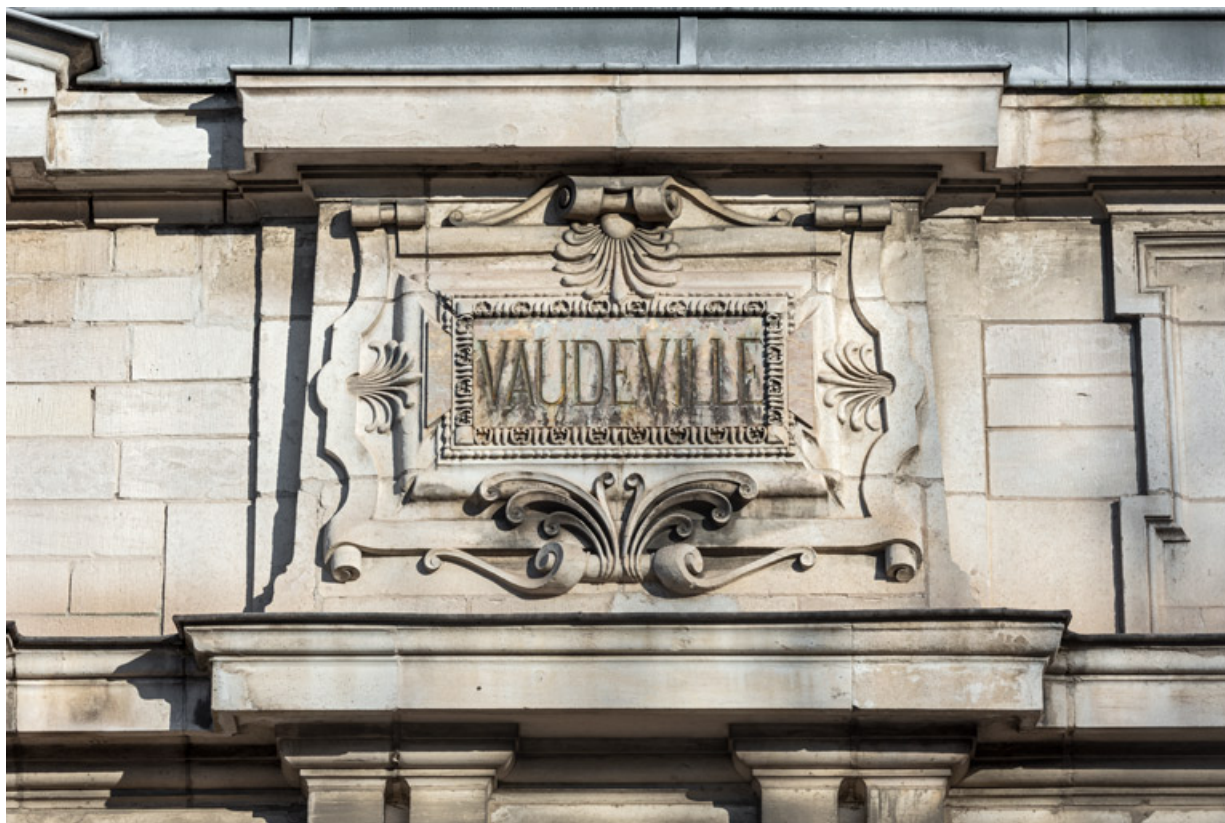
Façade latérale droite, attique : inscription Vaudeville.