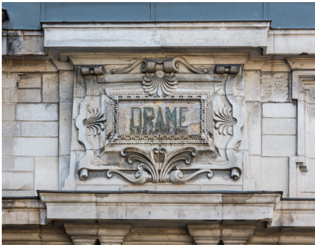
Façade latérale gauche, attique : inscription Drame.