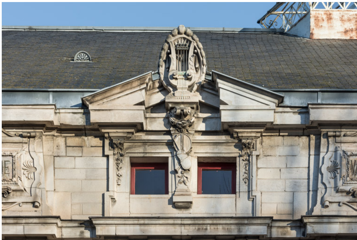
Façade latérale droite, attique : baies et fronton formant l'amortissement de la travée centrale. 89, Sens, 1-2 boulevard des Garibaldi