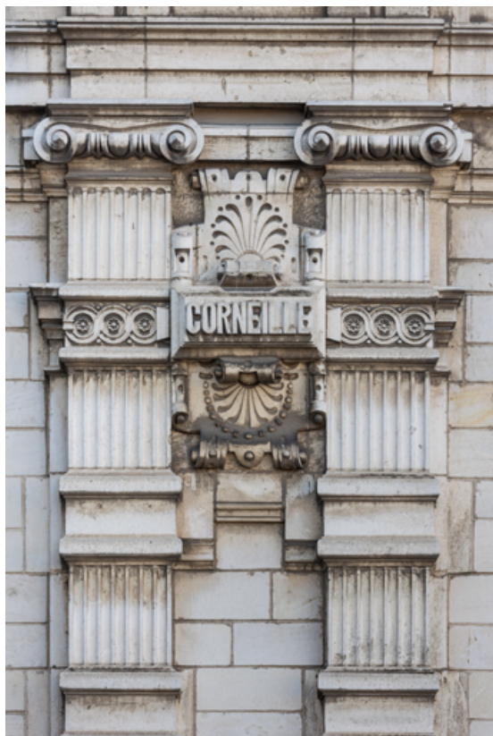
Façade latérale gauche, étage carré : pilastres et inscription Corneille. 89, Sens, 1-2 boulevard des Garibaldi