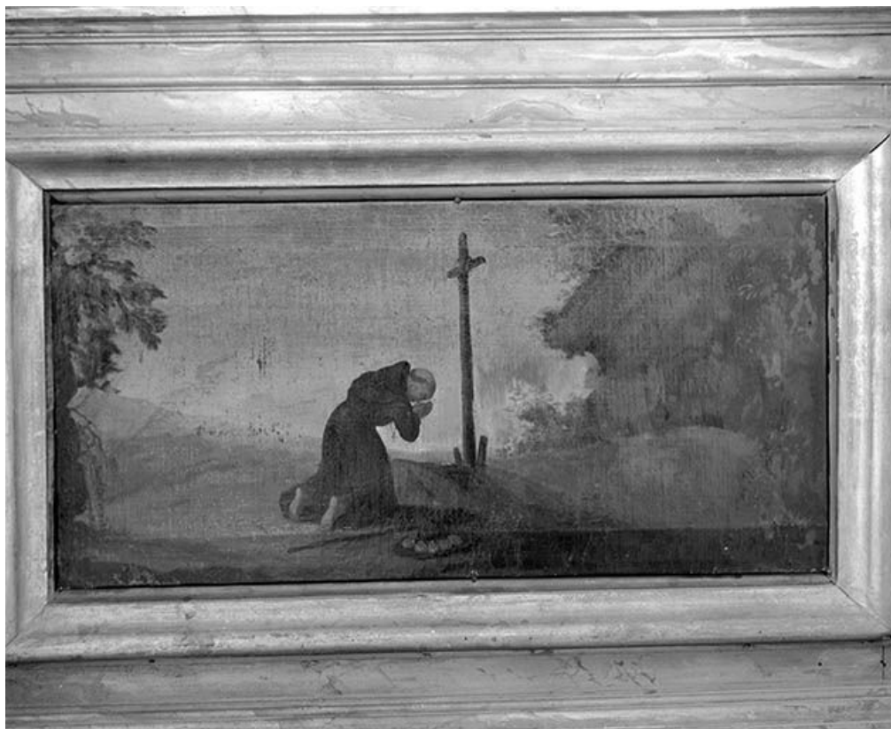
Détail d'un panneau du retable.