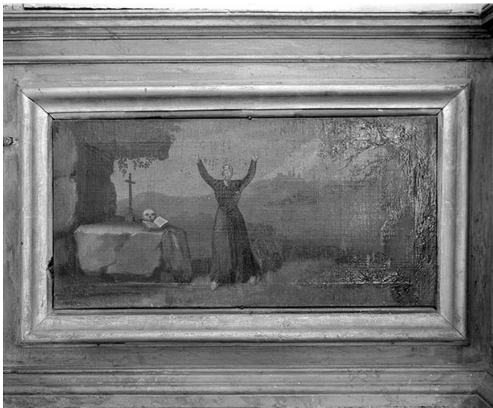
Détail d'un panneau du retable.