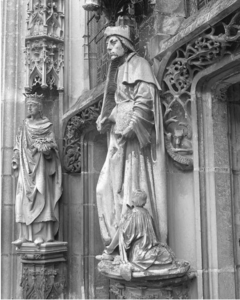
Trois-quarts gauche. 89, Ravières