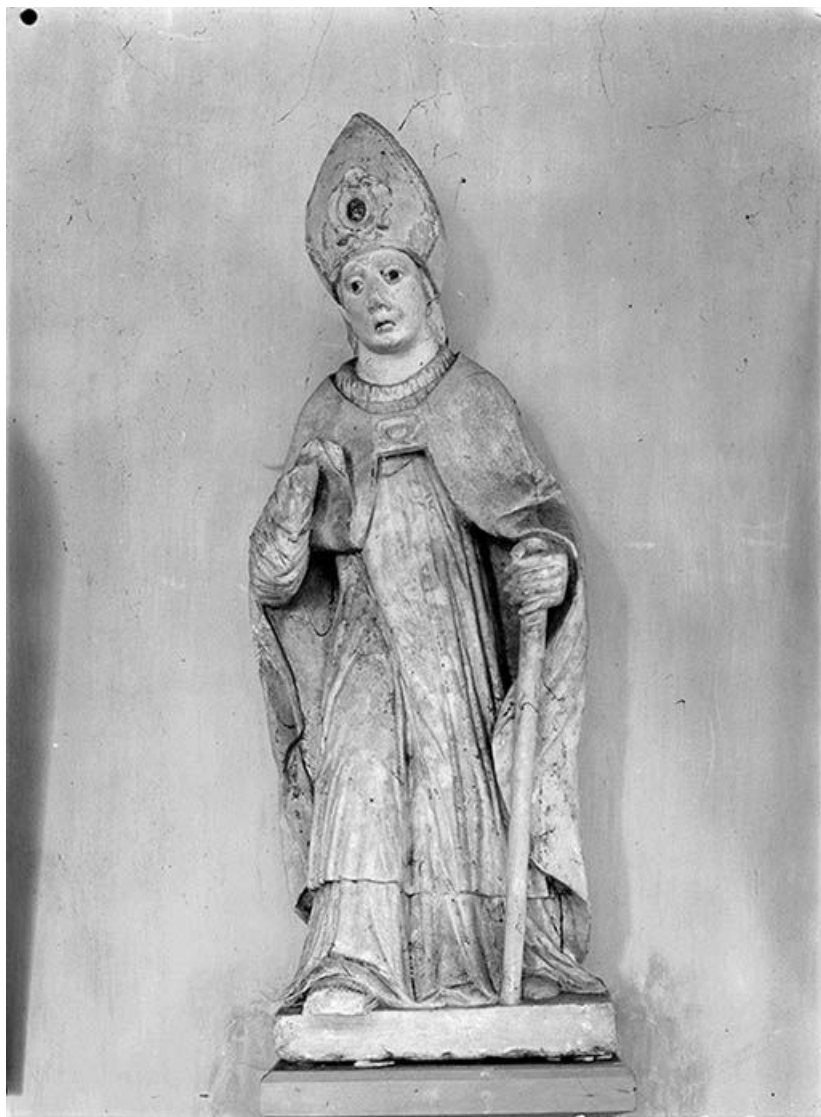
Face. 89, Pacy-sur-Armançon