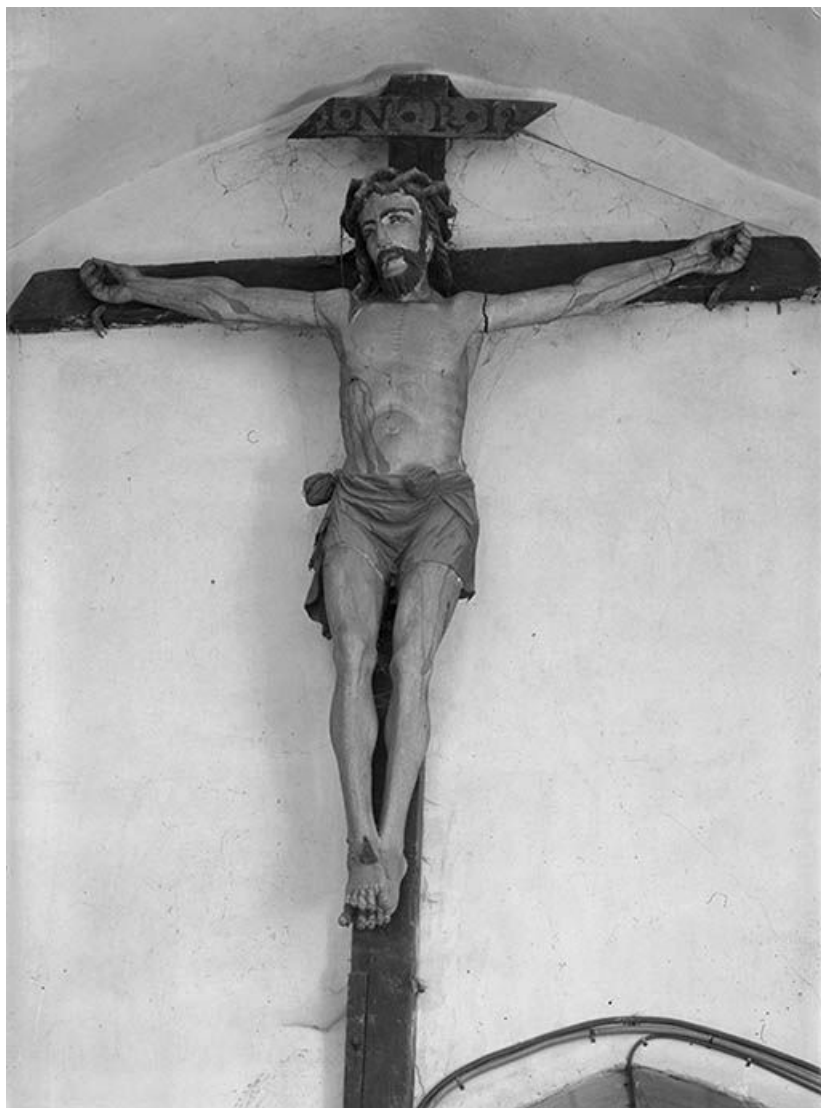
Face. 89, Nuits