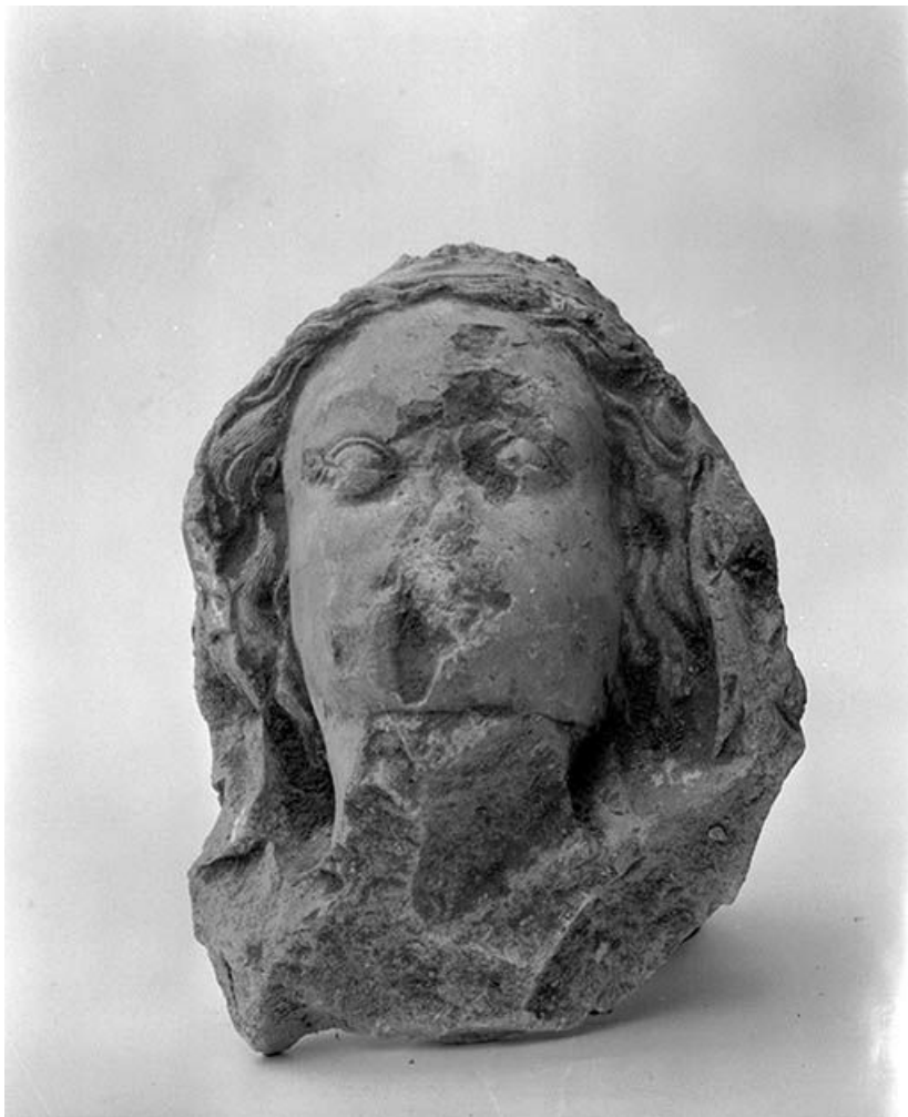
Fragment de statue : la tête, vue de face.