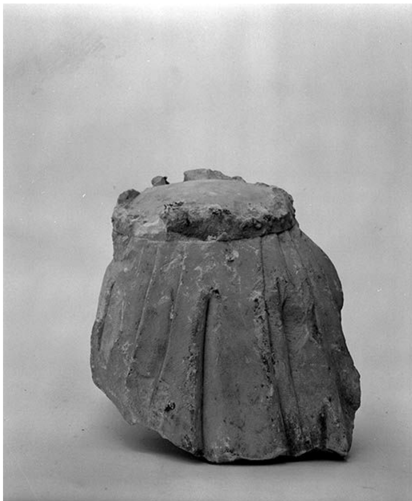
Fragment de statue : la tête, revers.