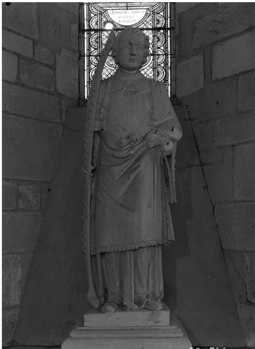
Face. 89, Lézennes