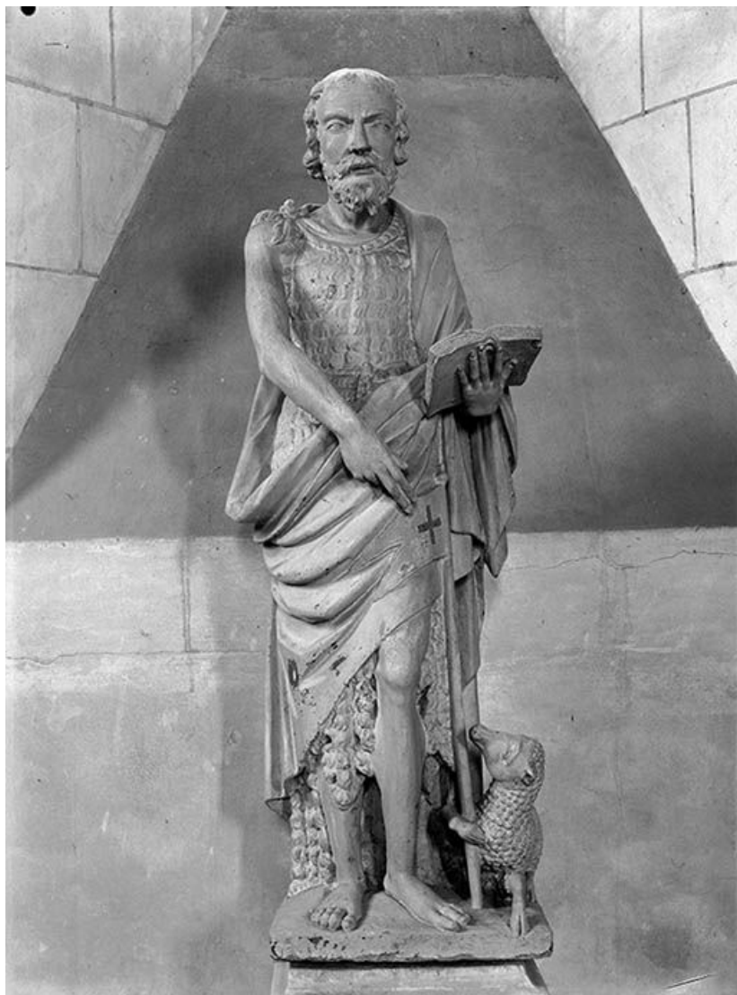
Face. 89, Lézennes