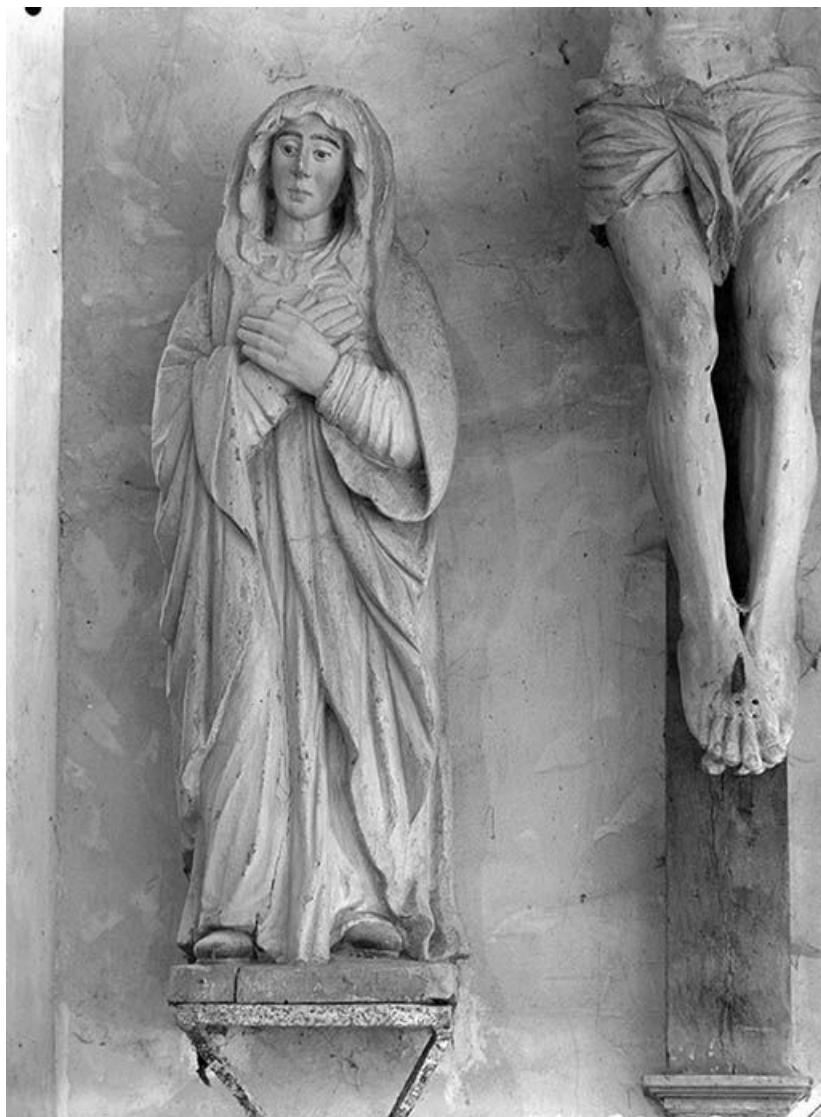
Détail : Vierge.