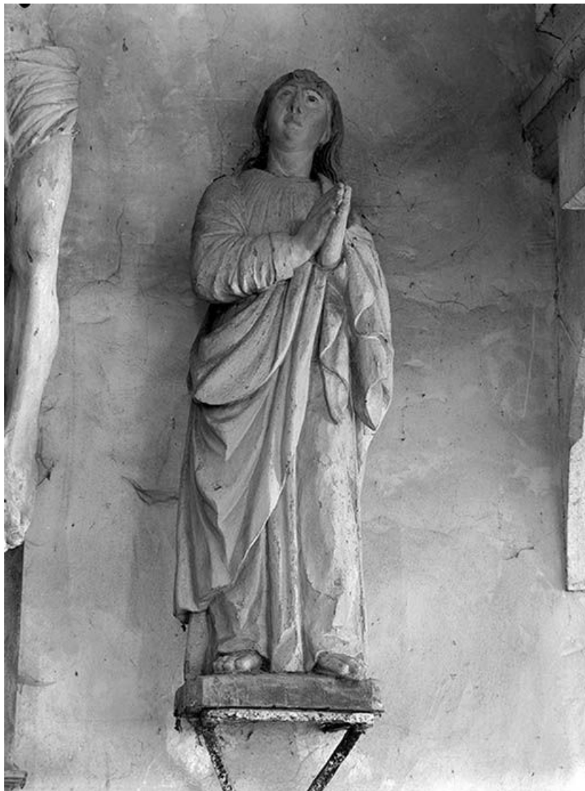
Détail : saint Jean.