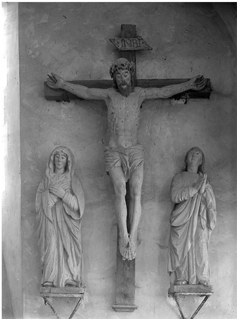
Vue d'ensemble : face.