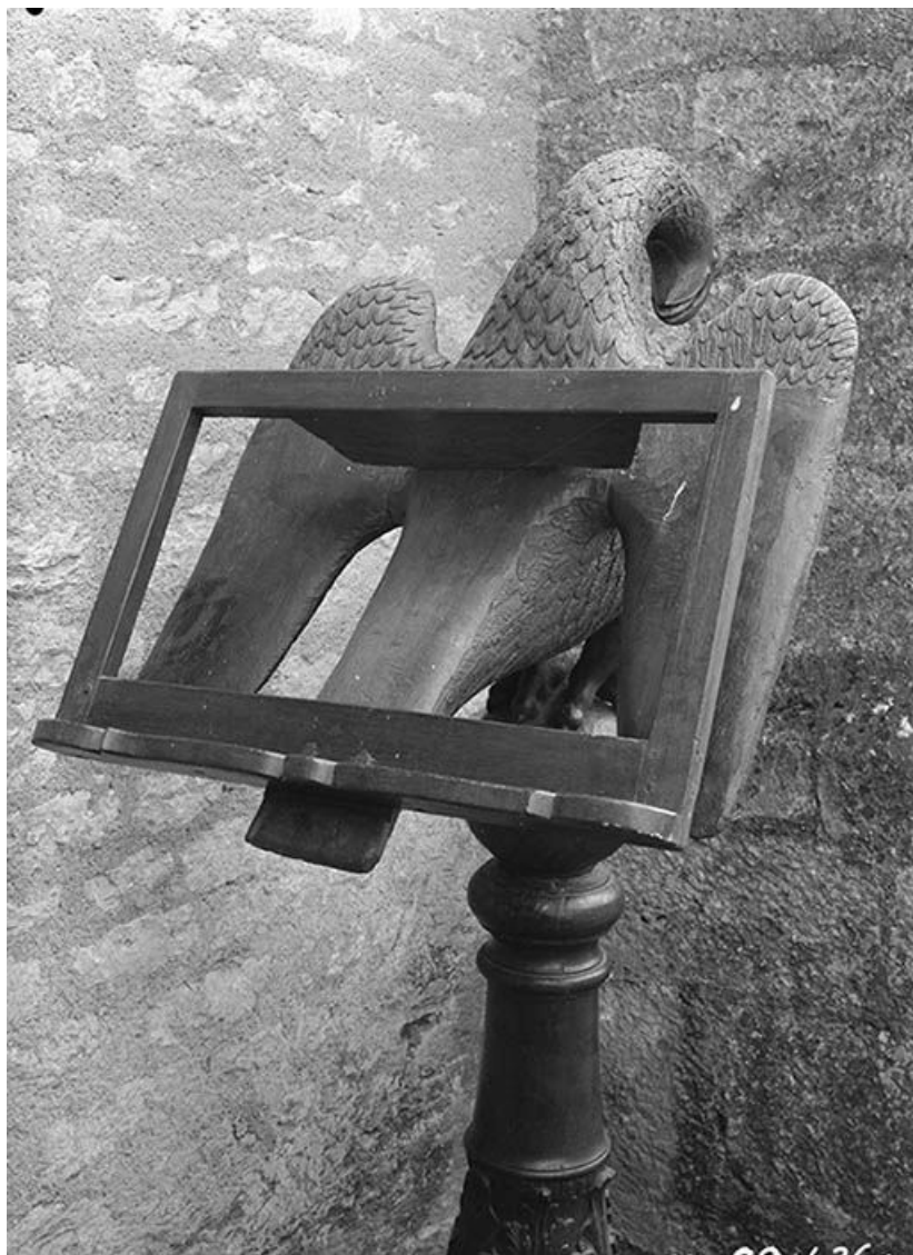
Détail : pupitre, trois-quarts droit.