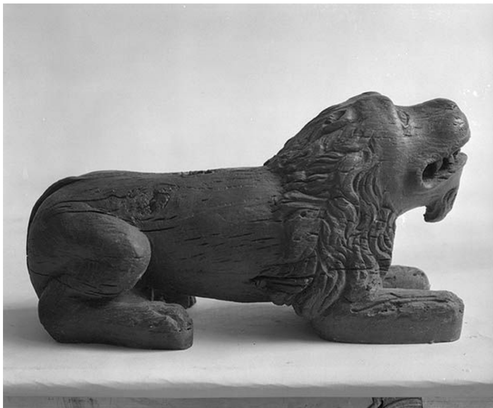
Détail : un des trois lions qui portent le pied. 89, Cry