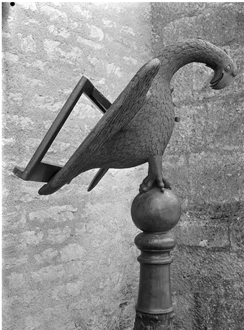
Détail : pupitre, profil droit. 89, Cry