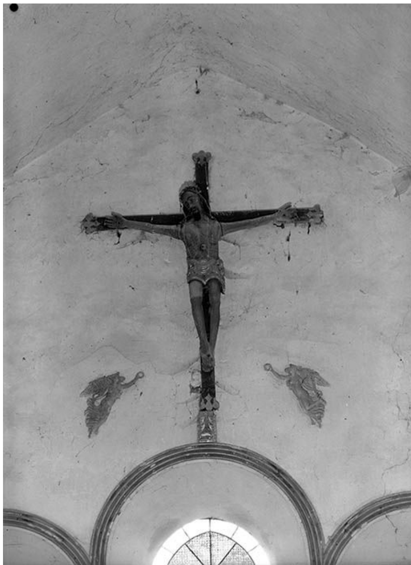
Vue d'ensemble : face.