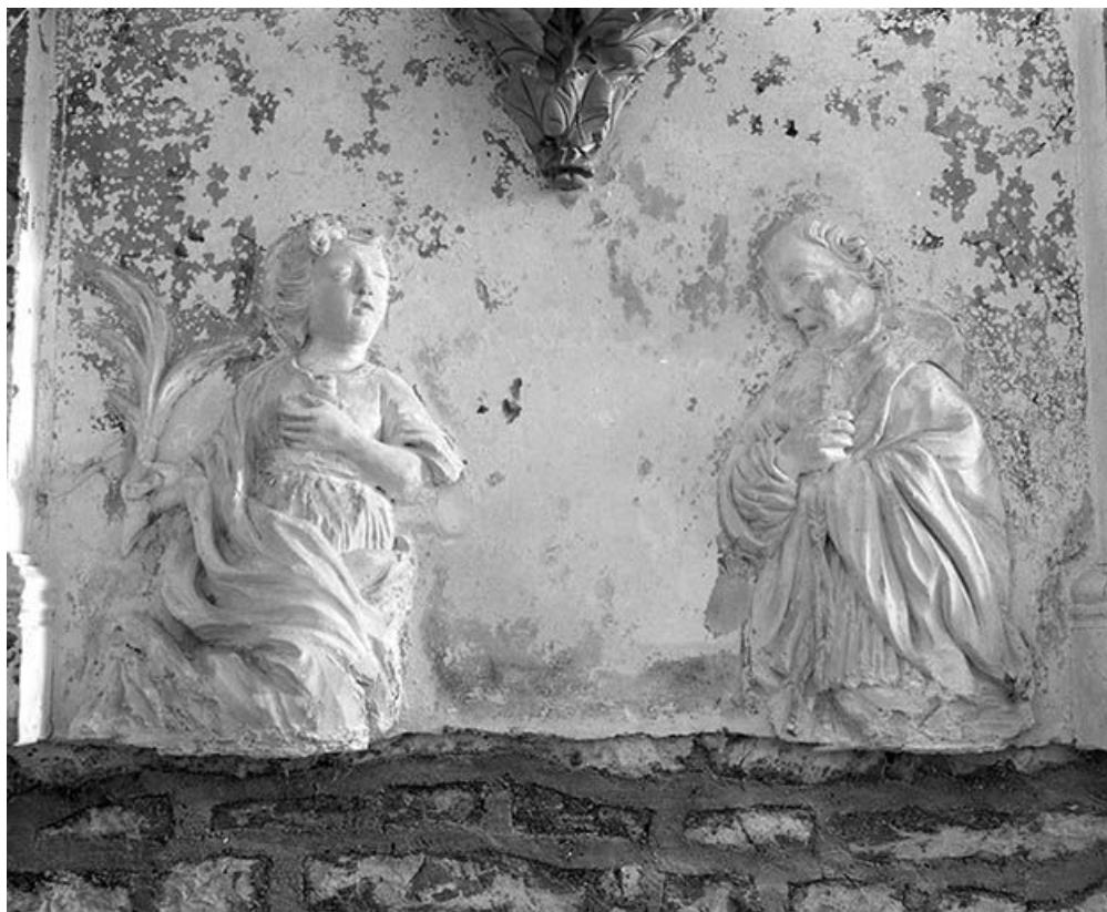
Détail statuettes : sainte avec palme et saint Charles Borromée.