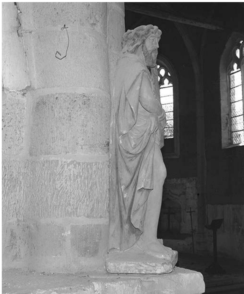
Vue d'ensemble : profil droit.