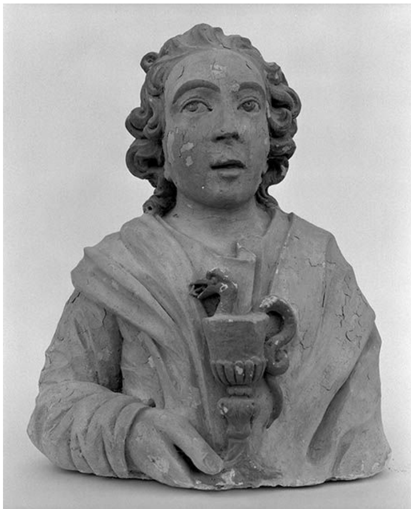
Saint Jean l'Evangéliste : face.