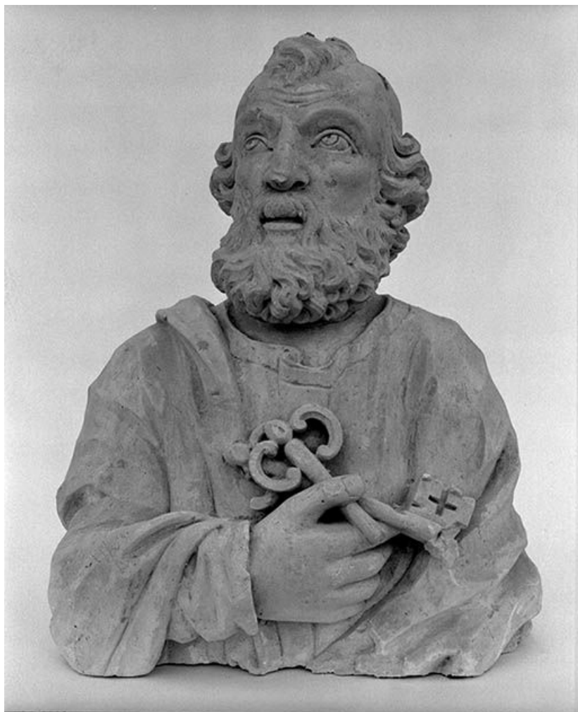
Saint Pierre : face.