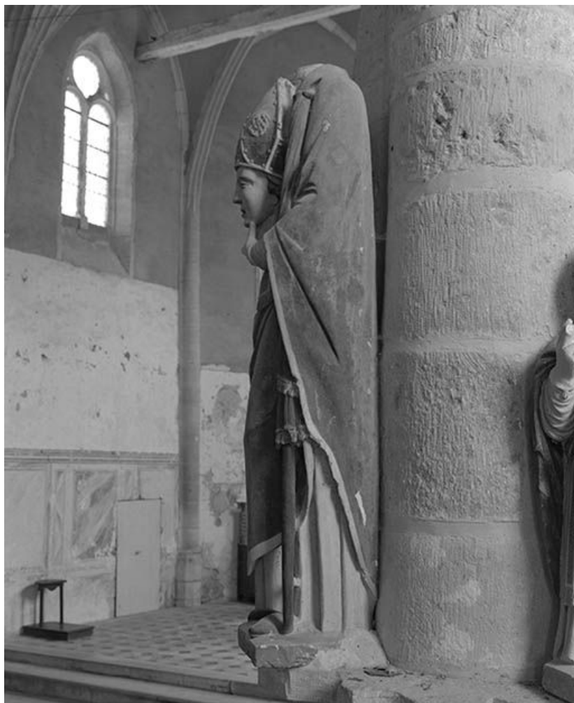
Vue d'ensemble : profil gauche.