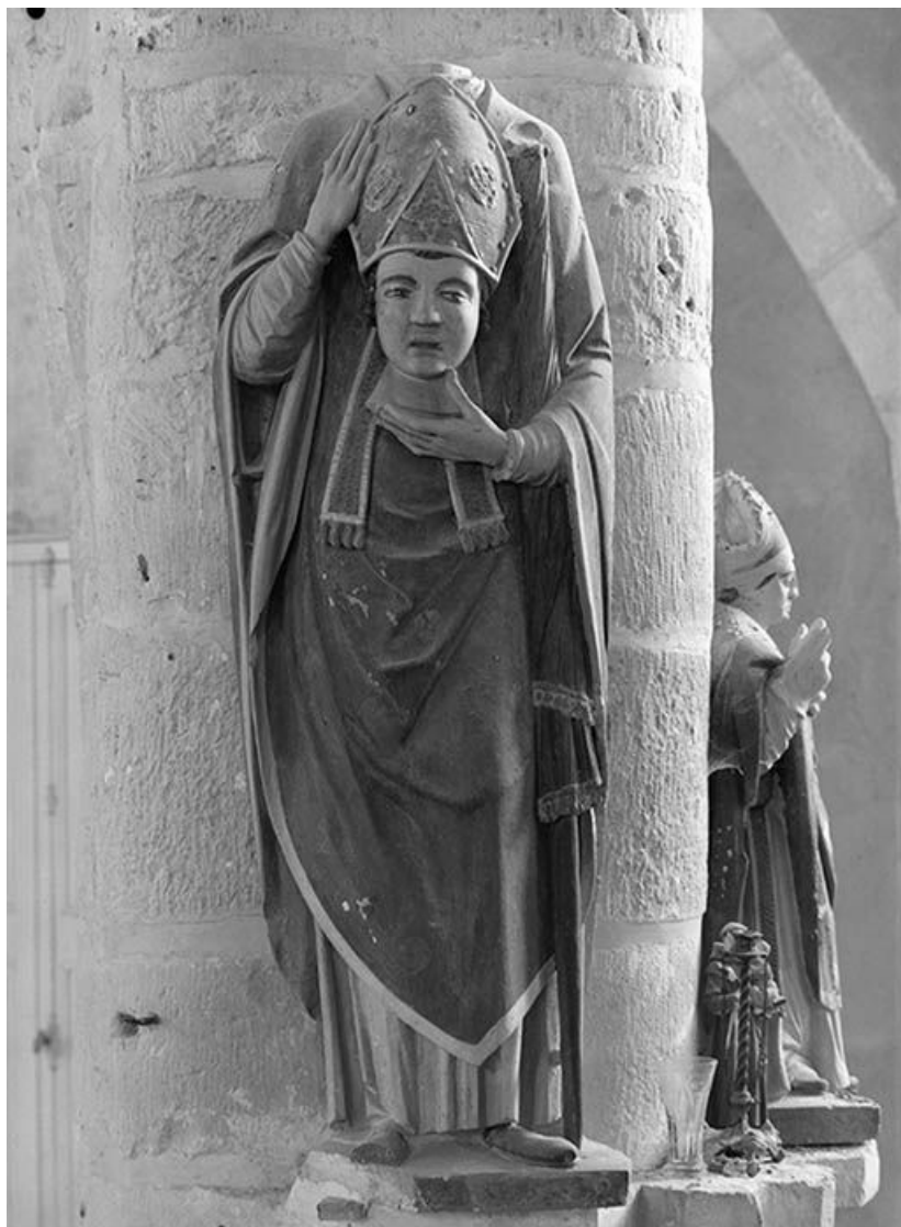
Vue d'ensemble : face.