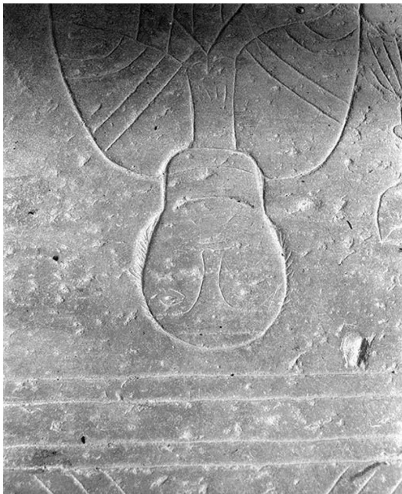
Détail : visage du gisant gravé.