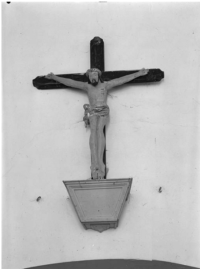
Vue d'ensemble : face.