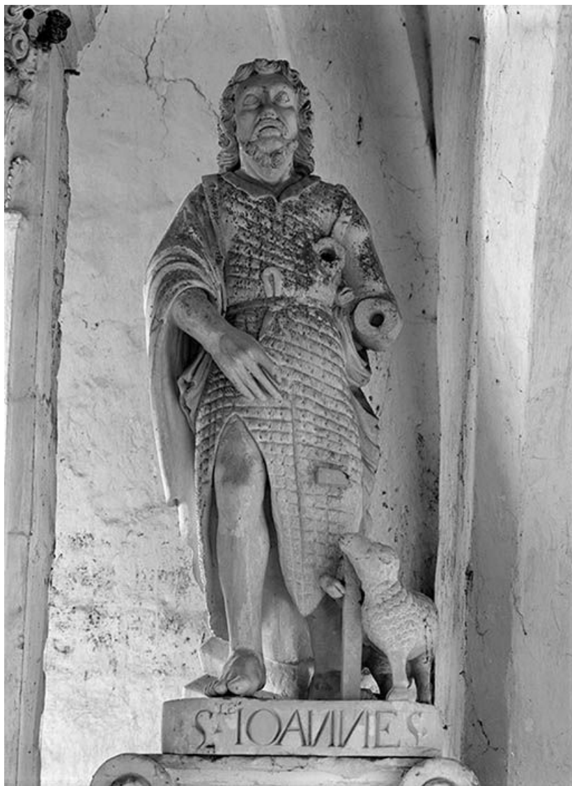
Saint Jean-Baptiste : face.