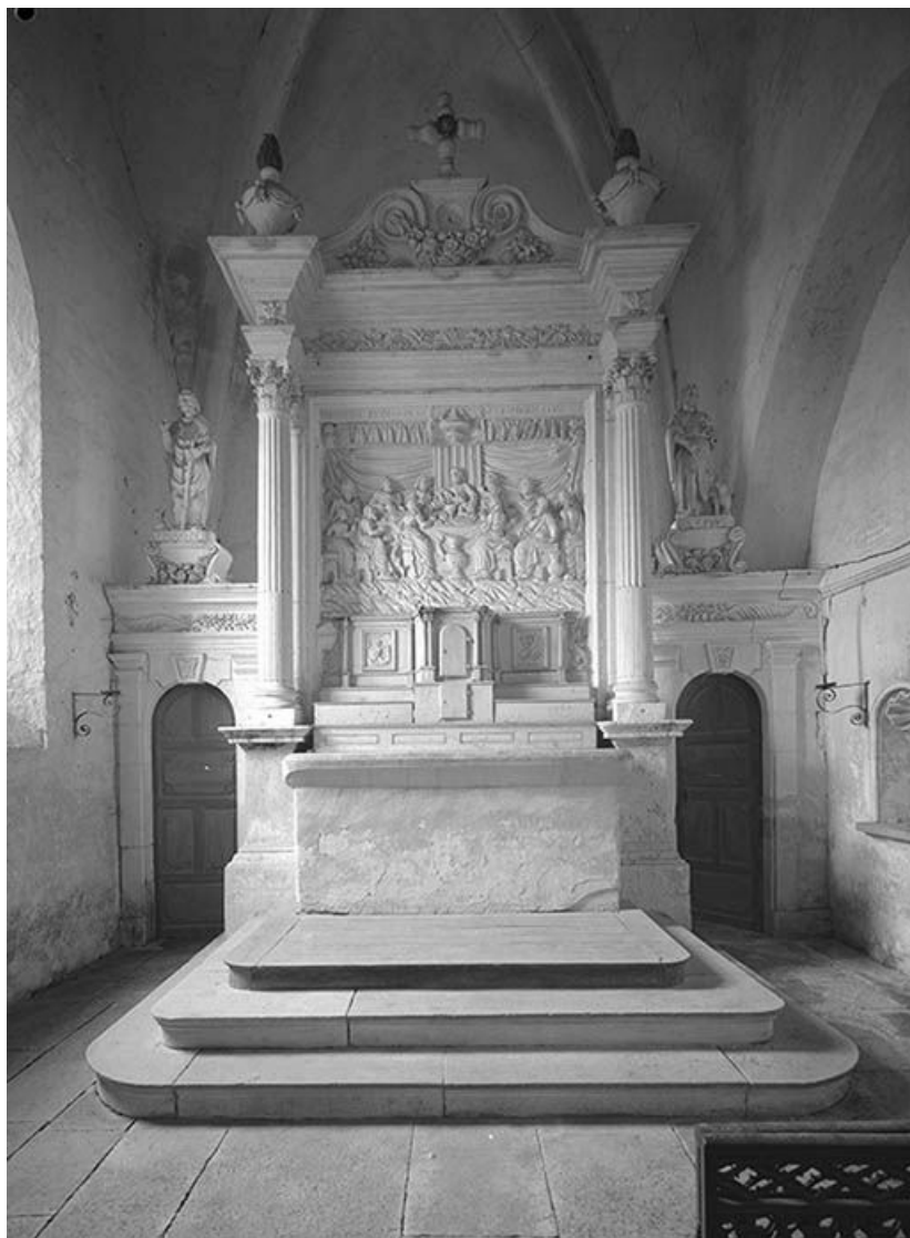
Maître-autel et retable : vue d'ensemble.