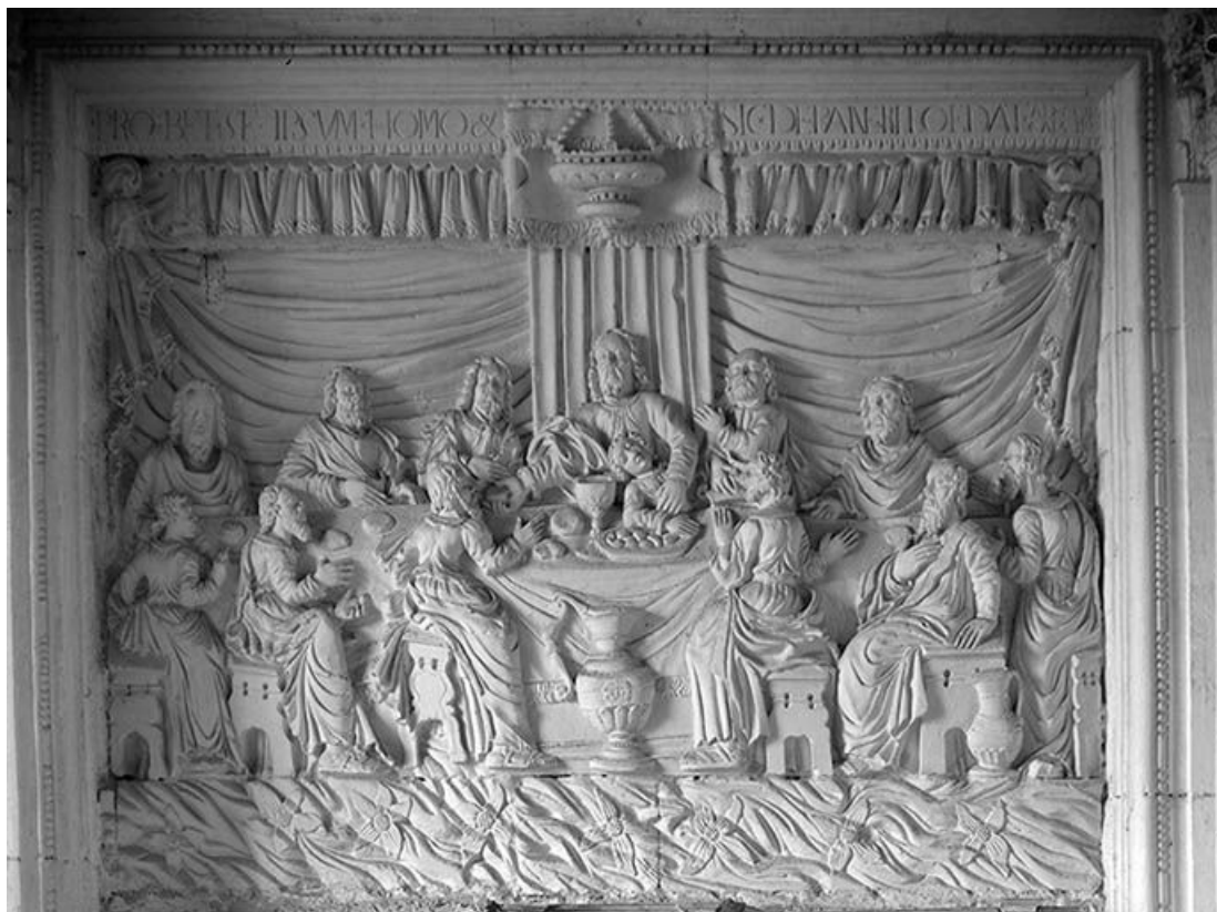
Détail du relief : la Cène.