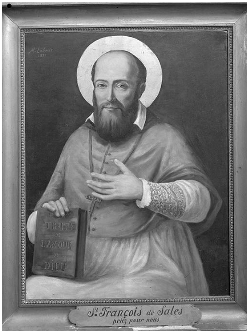
Vue d'ensemble. 89, Ancy-le-Franc