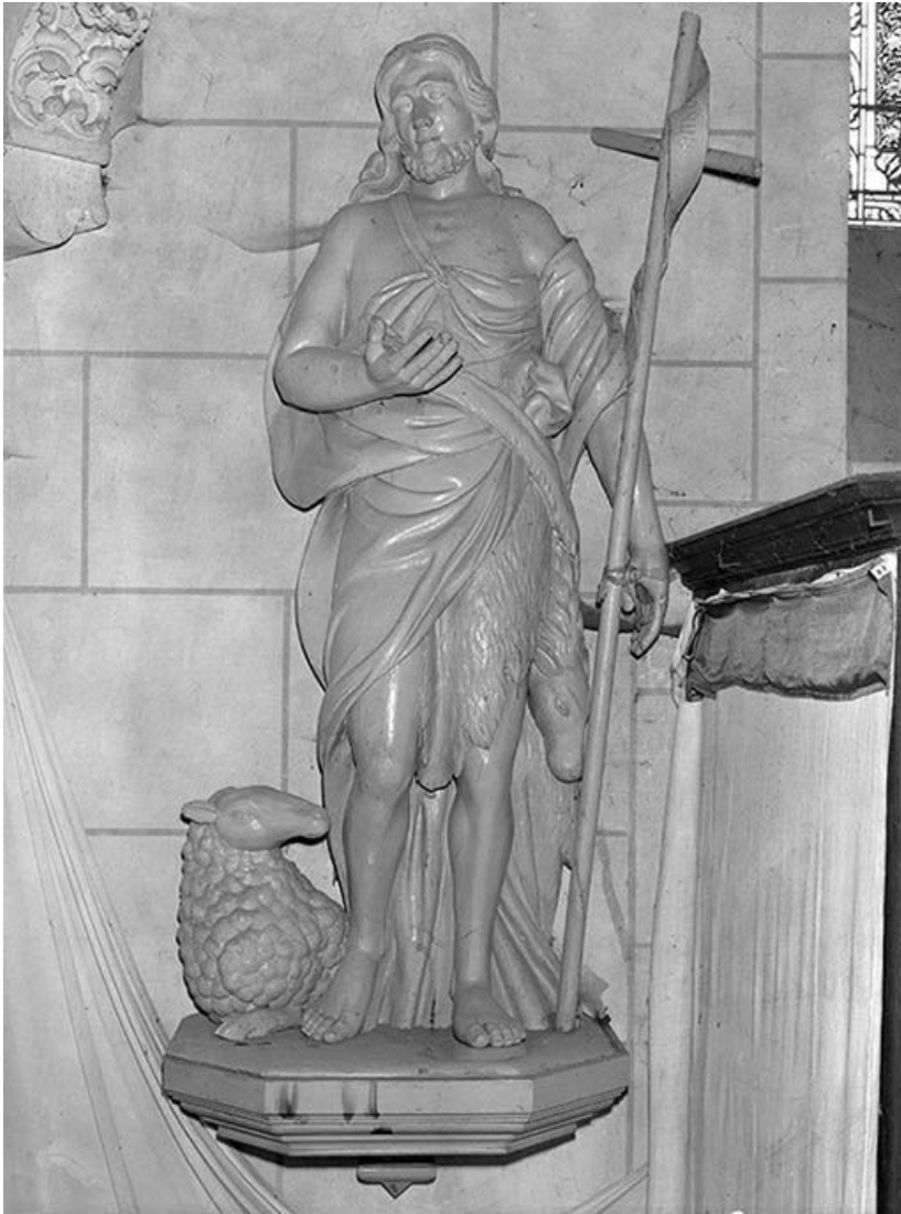
Vue d'ensemble : face.