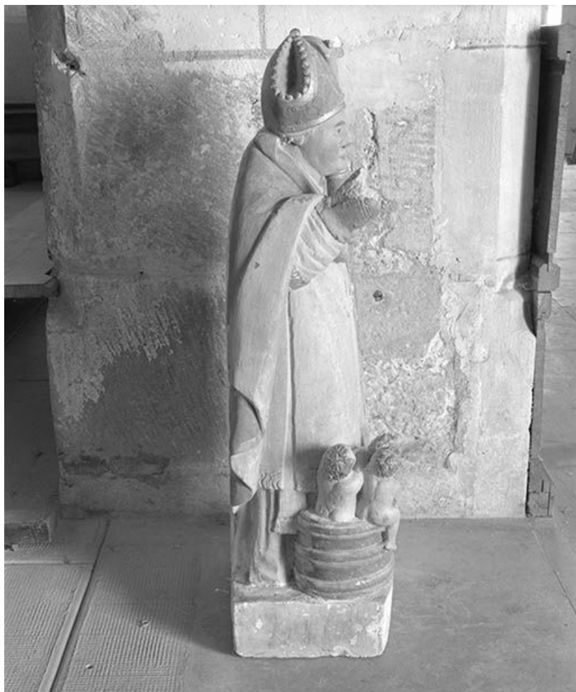
Vue d'ensemble de profil droit.