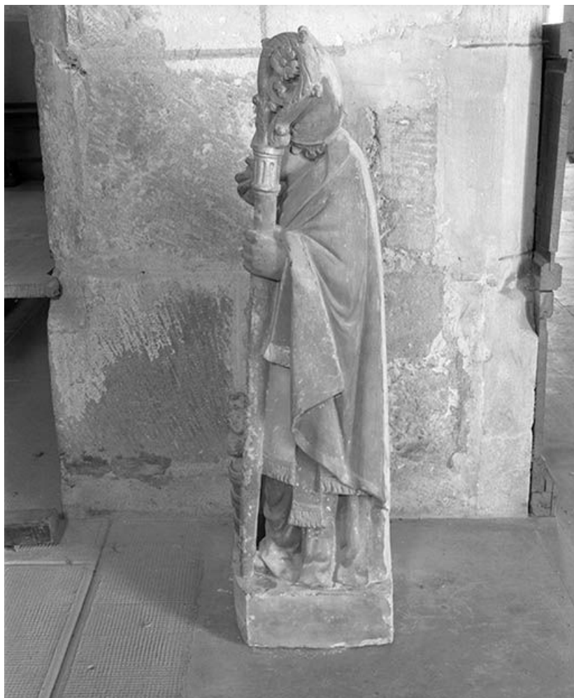
Vue d'ensemble de profil gauche.