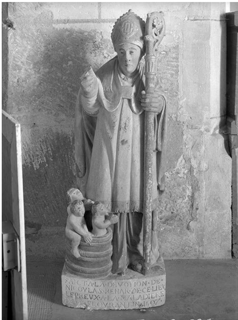
Vue d'ensemble de face.