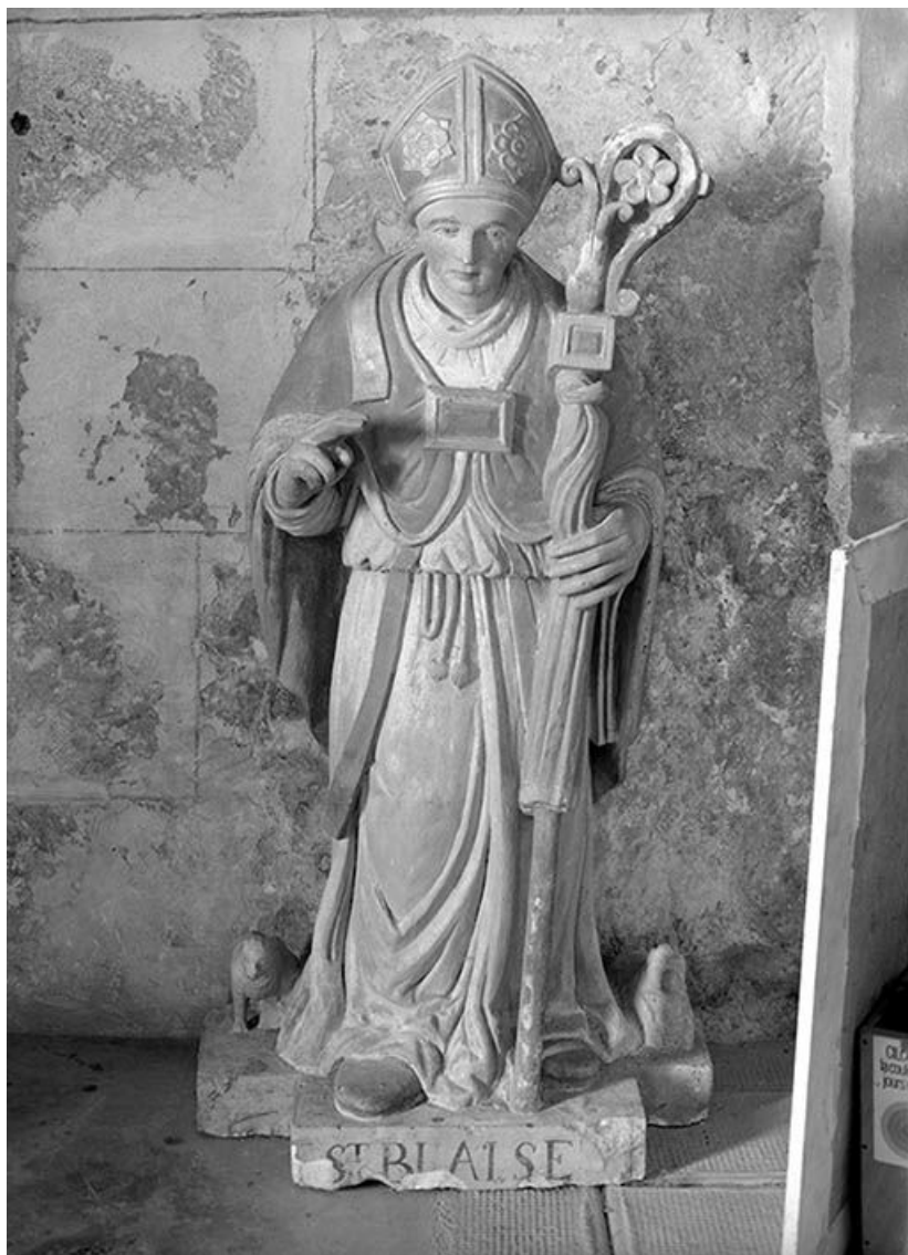
Vue d'ensemble de face.