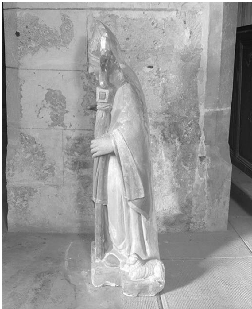
Vue d'ensemble de profil gauche.