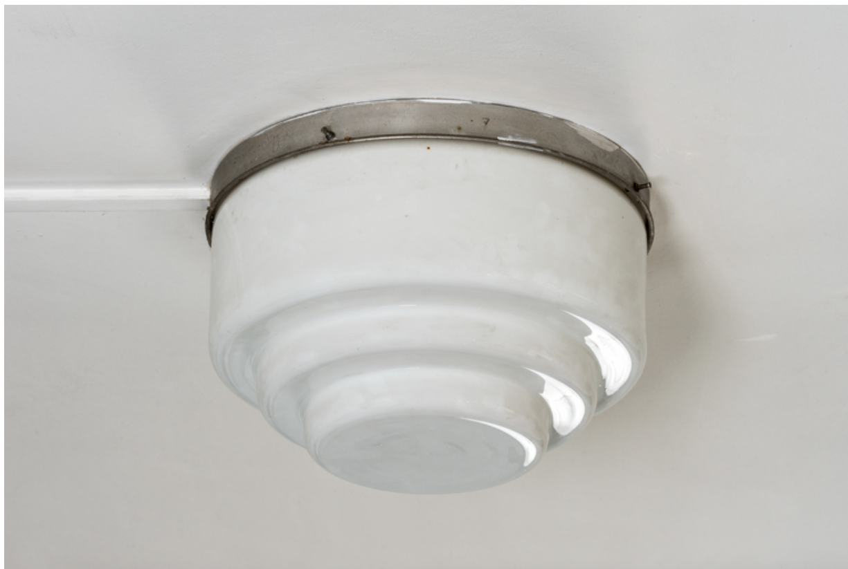
Galerie vitrée : luminaire d'applique.