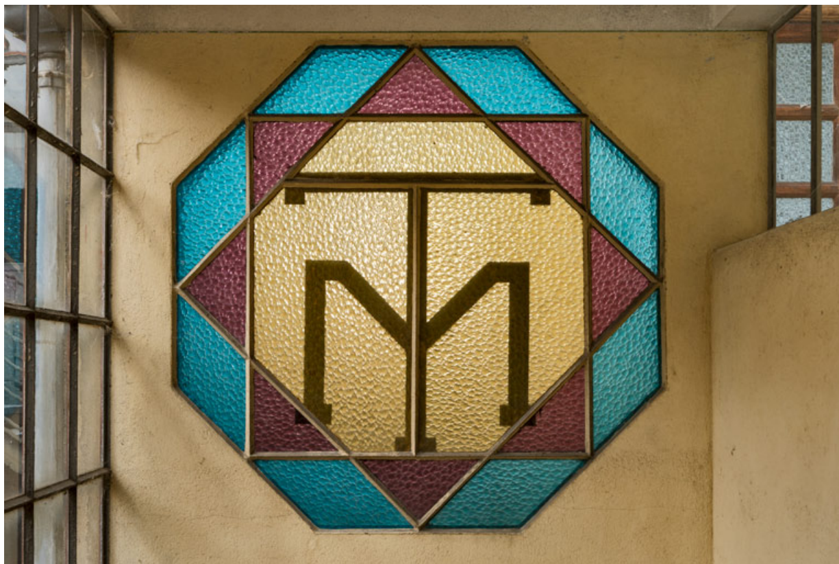
Escalier principal : verrière.