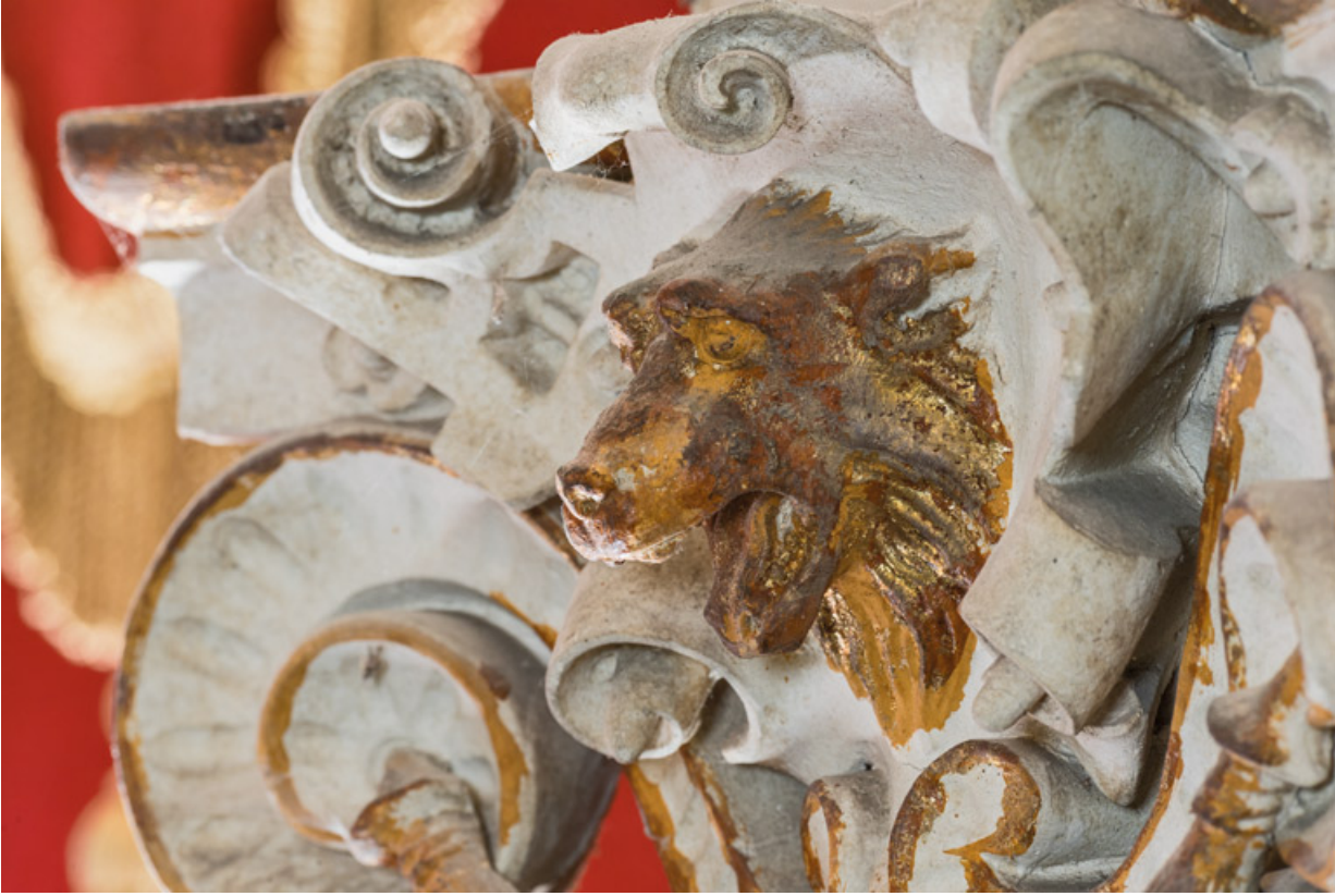
Chapiteau corinthisant : tête d'ours ou de loup.