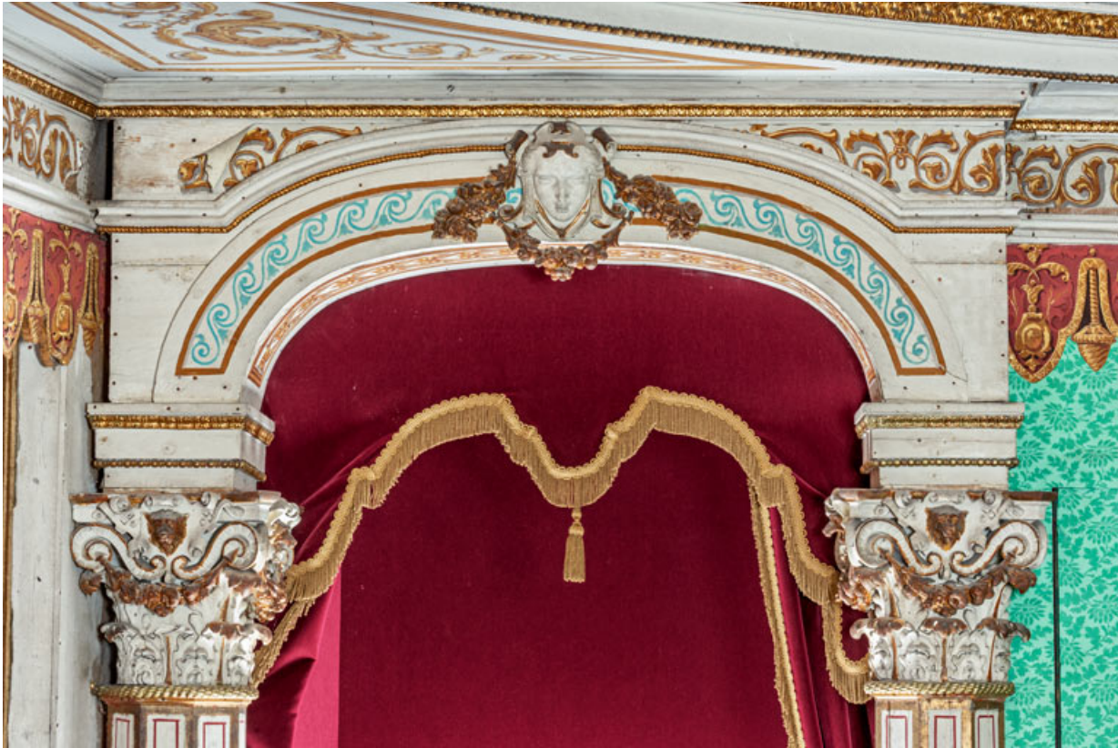
Loge d'avant-scène côté cour, au balcon : décor de la partie supérieure de la baie. 71, Palignes, lieudit : Digoine