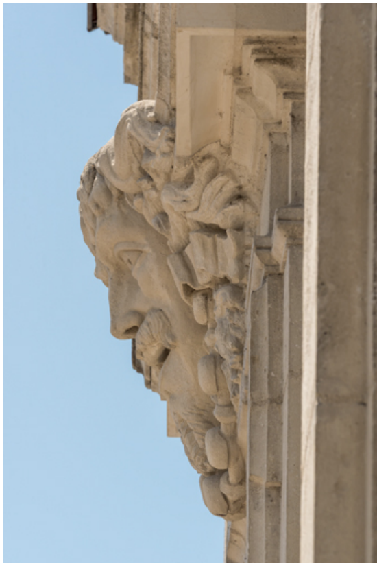
La Comédie, vue de profil et en contre-plongée. 71, Autun place du Champ-de-Mars