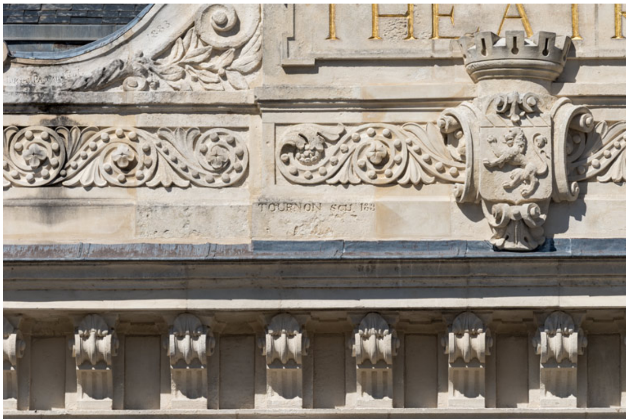
Fronton : armoiries de la ville d'Autun, signature de Tournon et date.