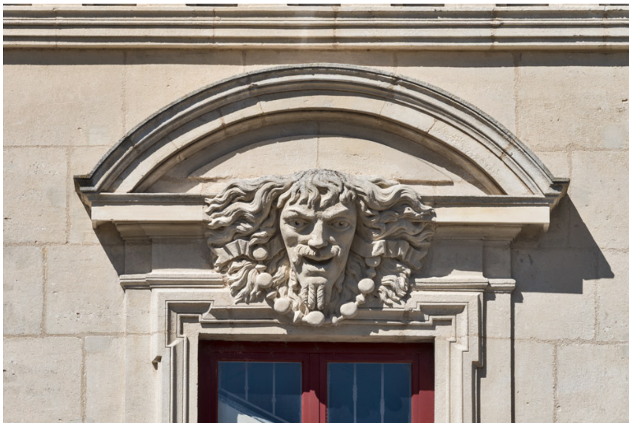
La Comédie, de Lucien Pascal. 71, Autun place du Champ-de-Mars