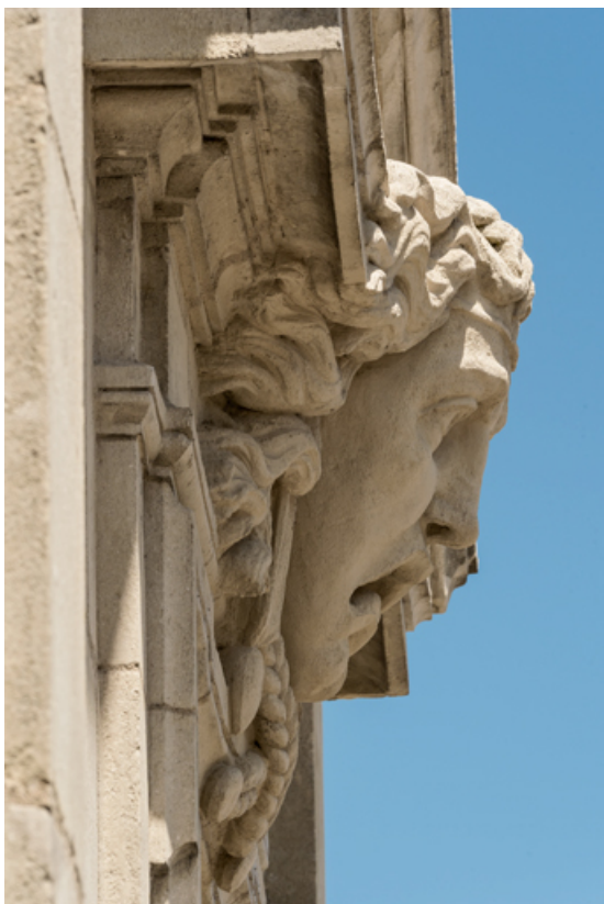
La Tragédie, vue de profil et en contre-plongée. 71, Autun place du Champ-de-Mars