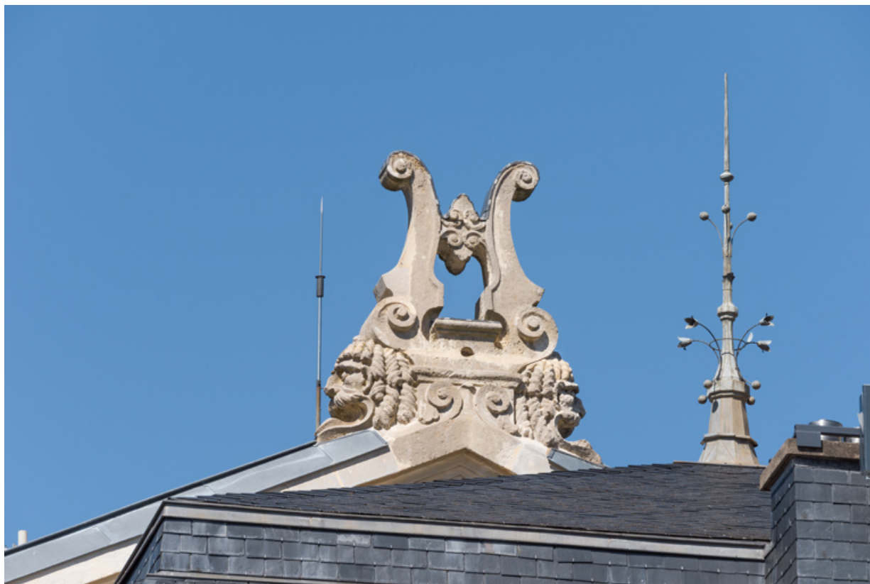
Lyre sur le pignon sud de la cage de scène. 71, Autun place du Champ-de-Mars