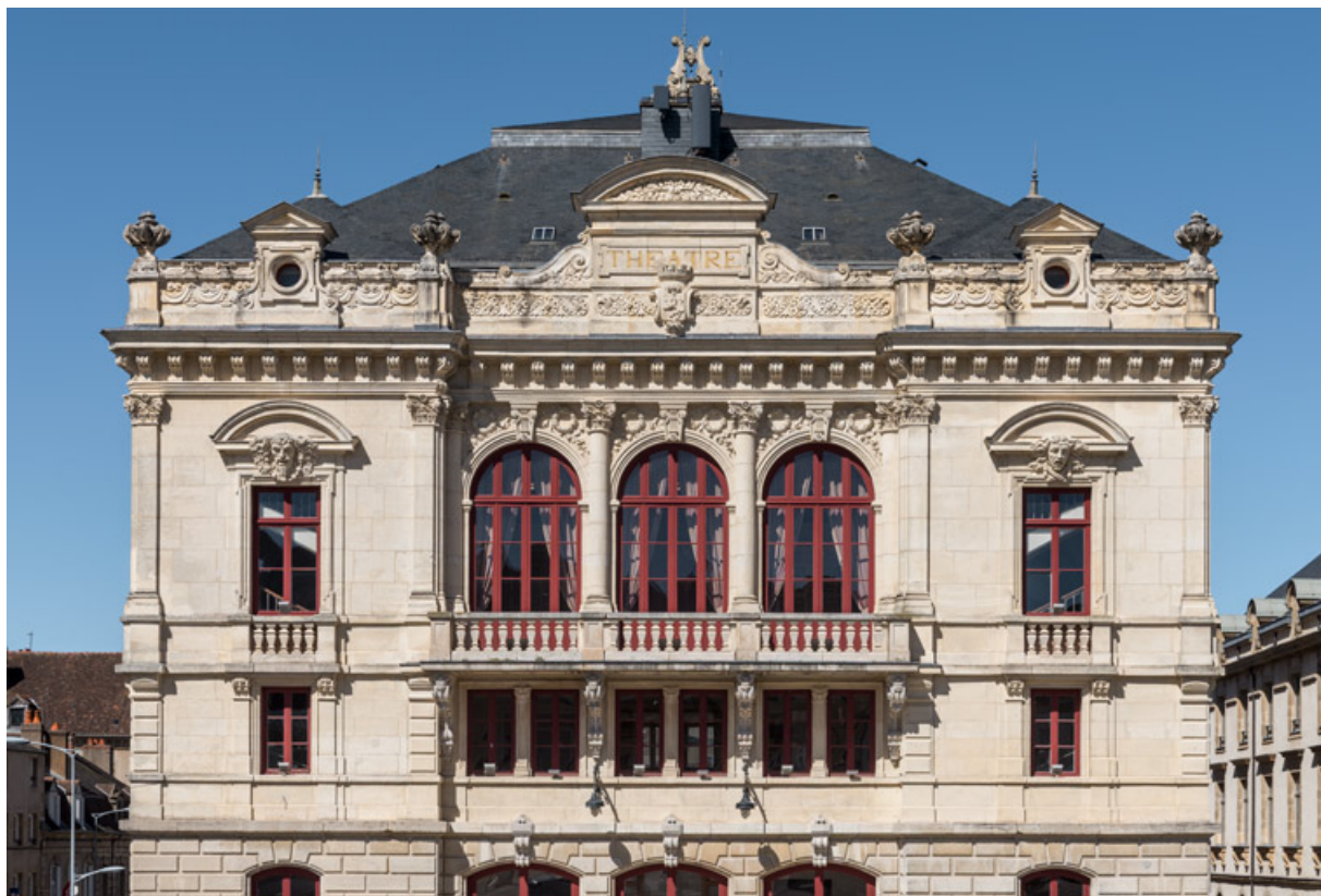
Décor sur la partie supérieure de la façade antérieure.