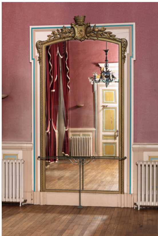
Grand foyer du public (salon d'honneur) : miroir.