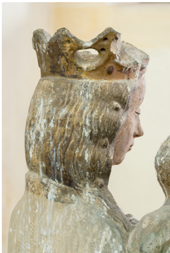
Détail : chevelure de la Vierge.

71, Sennecey-le-Grand rue de l' Église Saint-Julien