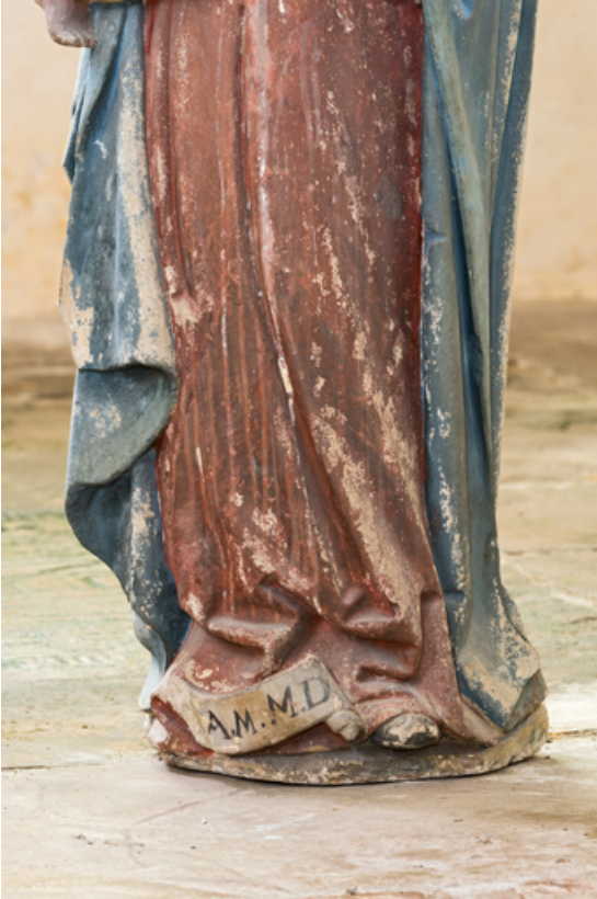
Détail : partie inférieure.

71, Sennecey-le-Grand rue de l' Église Saint-Julien