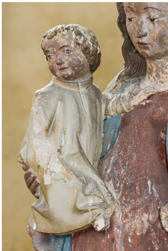
Détail : l'Enfant.

71, Sennecey-le-Grand rue de l' Église Saint-Julien