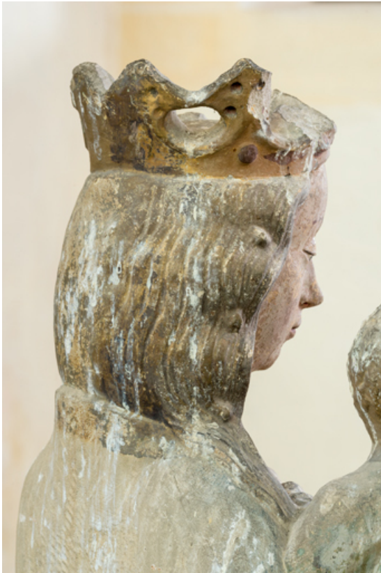
Détail : chevelure de la Vierge.

71, Sennecey-le-Grand rue de l' Église Saint-Julien