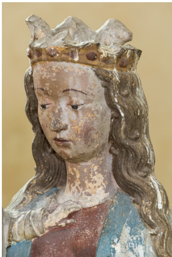
Détail : visage de la Vierge.

71, Sennecey-le-Grand rue de l' Église Saint-Julien