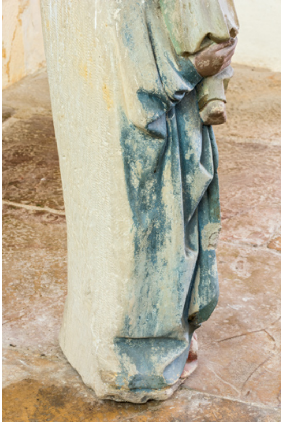
Détail : partie inférieure.

71, Sennecey-le-Grand rue de l' Église Saint-Julien