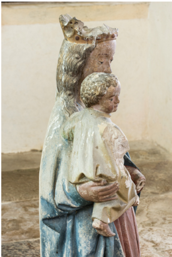
Détail : partie supérieure.

71, Sennecey-le-Grand rue de l' Église Saint-Julien