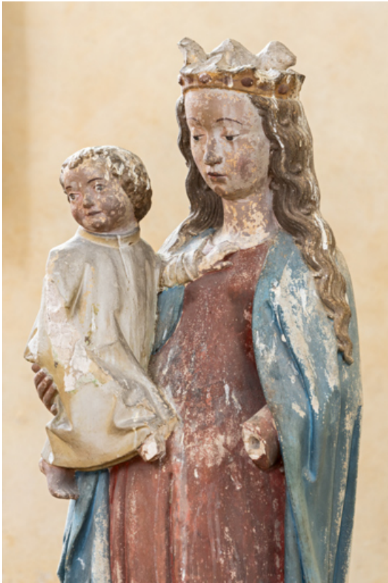
Détail : partie supérieure.

71, Sennecey-le-Grand rue de l' Église Saint-Julien