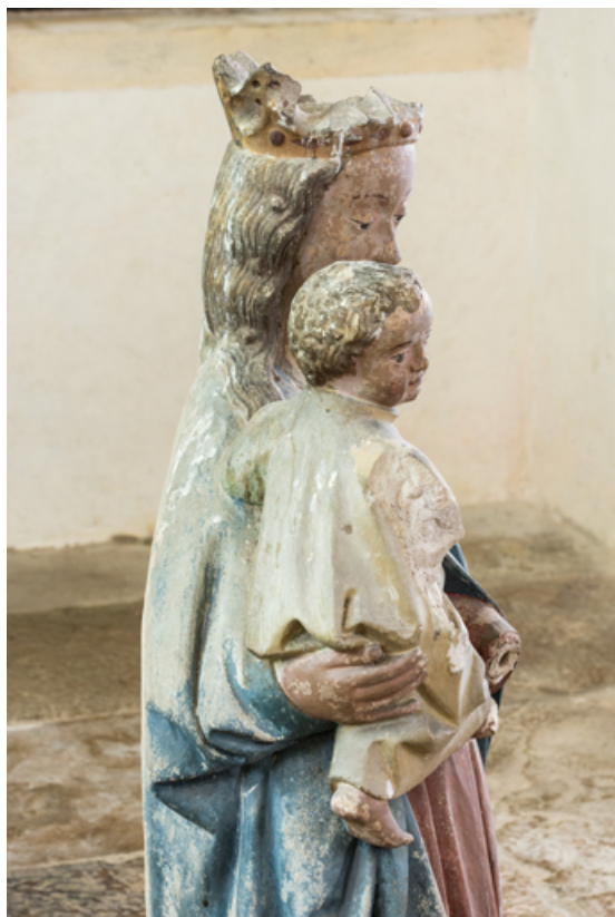
Détail : partie supérieure.

71, Sennecey-le-Grand rue de l' Église Saint-Julien