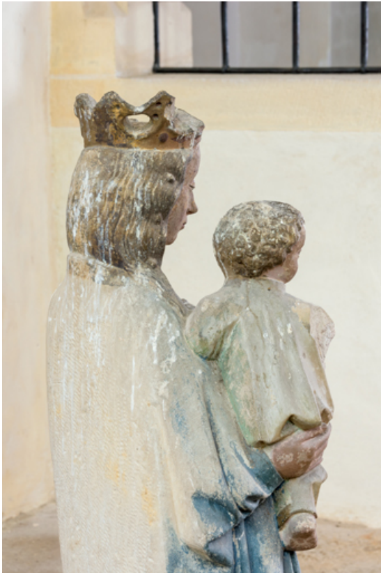
Détail : partie supérieure.

71, Sennecey-le-Grand rue de l' Église Saint-Julien