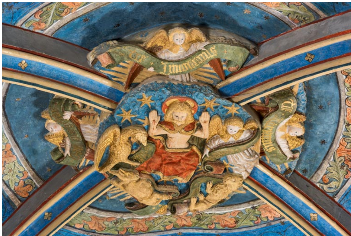
Clef de voûte de la travée orientale.

71, Sennecey-le-Grand rue de l' Église Saint-Julien