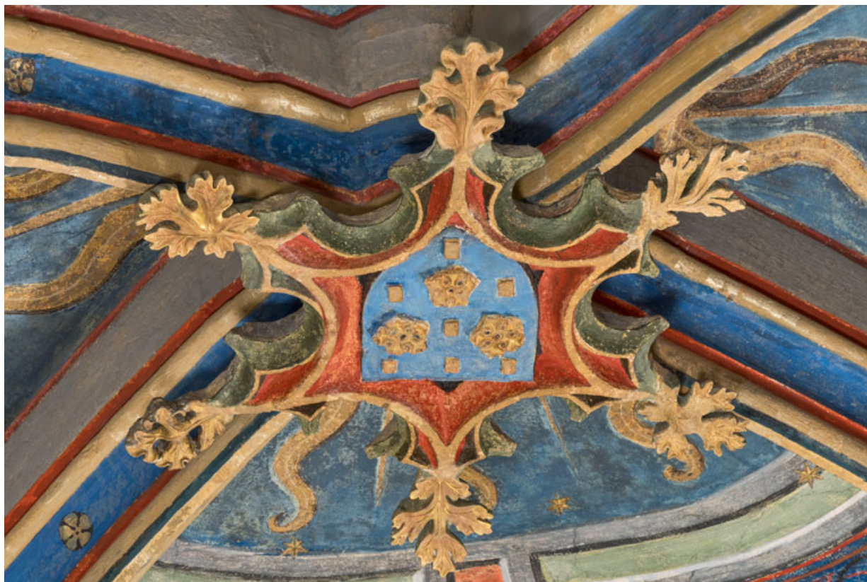
Clef de voûte de la travée occidentale.

71, Sennecey-le-Grand rue de l' Église Saint-Julien