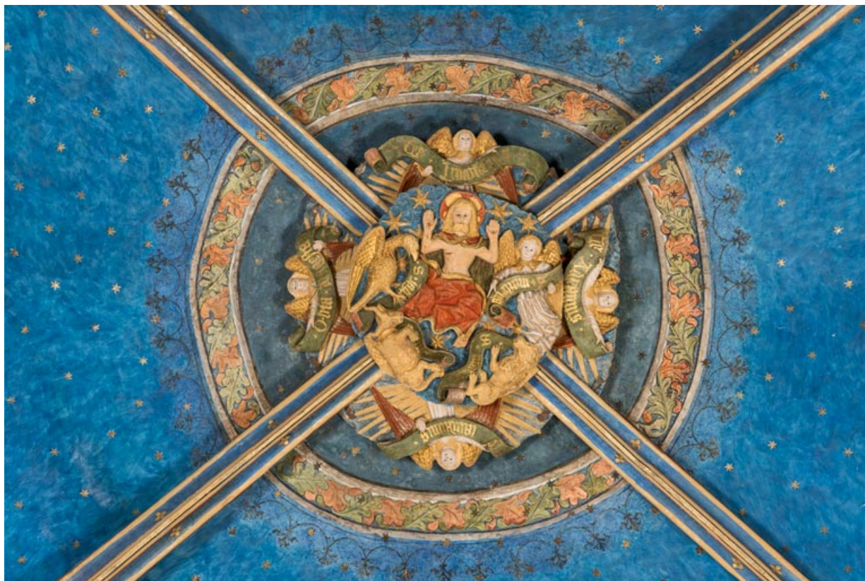
Clef de voûte de la travée orientale.

71, Sennecey-le-Grand rue de l' Église Saint-Julien