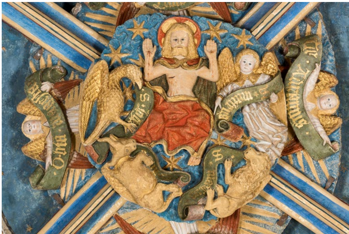
Clef de voûte de la travée orientale, détail.

71, Sennecey-le-Grand rue de l' Église Saint-Julien