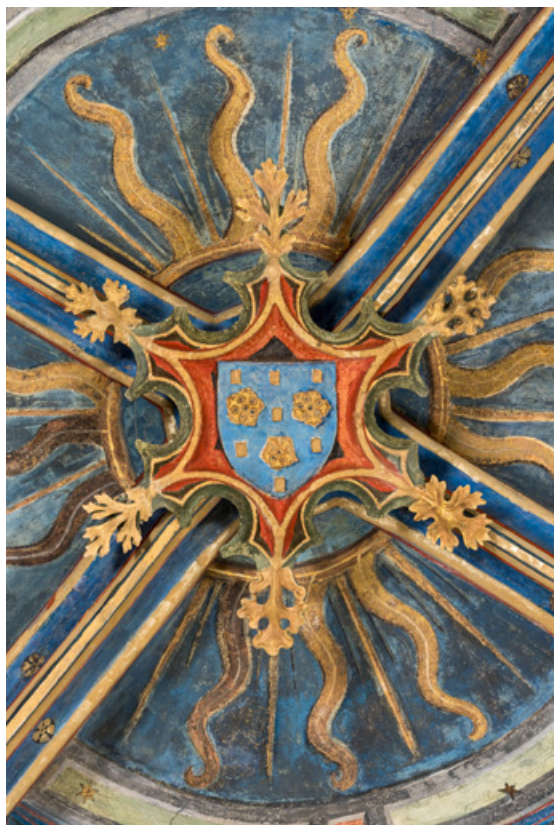
Clef de voûte de la travée occidentale.

71, Sennecey-le-Grand rue de l' Église Saint-Julien